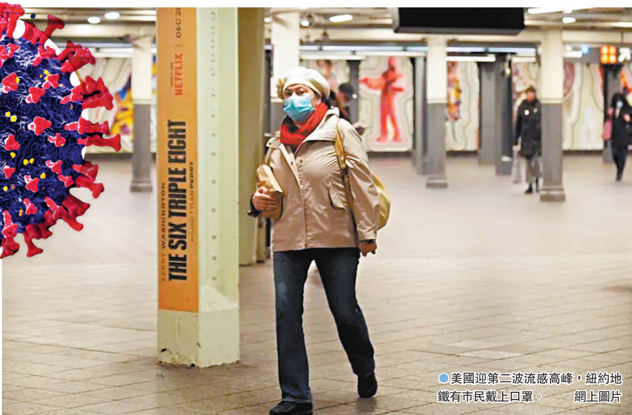
●美國迎第二波流感高峰，紐約地鐵有市民戴上口罩。