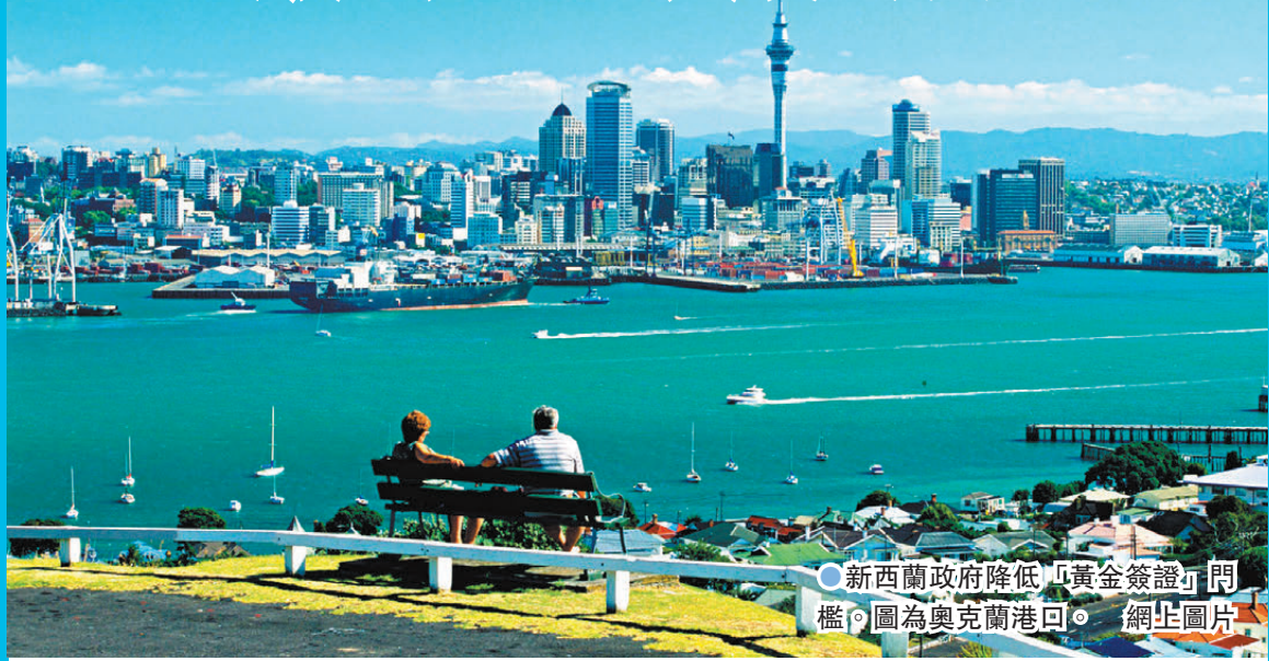
●新西蘭政府降低「黃金簽證」門檻。圖為奧克蘭港口。

香港文匯報訊 新西蘭政府周日(2月9日)宣布降低俗稱「黃金簽證」的投資移民簽證計劃門檻，取消其中的英語要求，並削減要求在該國停留的時間。總理拉克森在記者會上表示，「我們在新西蘭要說更多的yes，更少的no」，指出相應改變是為了吸引投資。