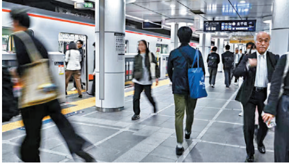
●東京地鐵乘客數量下降。

山村同時稱，去年東京地鐵進行總額23億美元(約179億港元)的首次公開募股後，公司需在股東投資回報及提供公共服務之間取得平衡，該公司還將業務擴至海外，已獲得營運倫敦伊利沙伯線的合約。