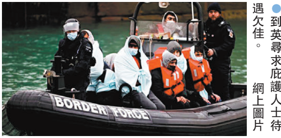
●到英尋求庇護人士待遇欠佳。 網上圖片

內政部一向不會主動公開其收容的非法移民死亡數據，人權及難民組織呼籲內政部應主動公開，國會跨黨派內政特別委員會正調查政府為尋求庇護者提供住宿的情況，也有慈善組織呼籲內政部提高相關死亡事件的透明度。