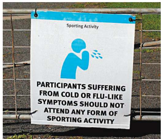
●美國多地街上貼有警告字句，提醒民眾注意衛生。