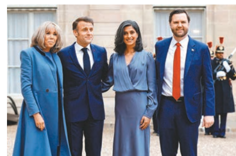
●美國副總統萬斯(右)代表美國出席峰會，與馬克龍夫婦合照。

代表未有簽署今屆AI峰會的聯合聲明。《衛報》引述英美兩國代表消息稱，美方對聲明中的「可持續和包容性AI技術」等措辭不滿，英方也要求聲明必須完全符合英國的利益，否則英方不會簽署。