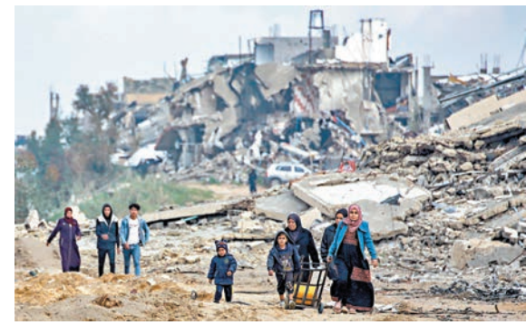
●特朗普指巴人無權返回加沙。

表示，哈馬斯應在周六中午釋放所有人質，否則應取消加沙停火協議。他同時表示，最終還是要由以色列方面來決定。