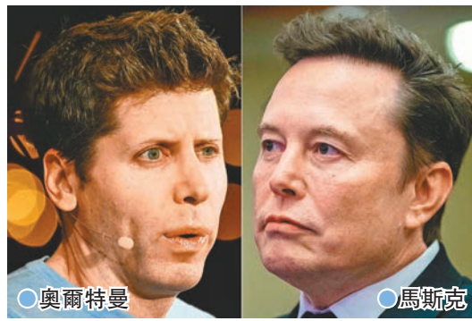
○奧爾特曼 ○馬斯克 報道指出，OpenAI的轉型面臨連串法律障礙，競爭對手科企Meta去年12月致函加州總檢察長，反對OpenAI轉型。馬斯克也曾多次對OpenAI提起訴訟。

馬斯克的律師托貝羅夫表示，投資集團已將出價遞交OpenAI的董事會。托貝羅夫公開馬斯克的聲明，當中提及收購OpenAI旨在令其回歸最初的開源和安全導向，「我們將確保這一切發生。」馬斯克與奧爾特曼於2015年共同創立OpenAI作為非牟利機構。馬斯克2019年離開後，奧爾特曼擔任行政總裁，領導研發AI聊天機械人，並為OpenAI創建一間盈利性質的分公司用於籌集資金。OpenAI去年10月完成最新一輪融資，估值達1,570億美元(約1.22萬億港元)，機構承諾會在2026年底前完成轉型。馬斯克名下的AI企業xAI據報也會參與收購，若交易成事，xAI或會與OpenAI合併。托貝羅夫上月已致函OpenAI總部所在地加州，以及機構註冊地特拉華州的總檢察長，要求允許市場公開競購OpenAI，公平地確認其市值。OpenAI指責馬斯克團隊的法律主張毫無根據。