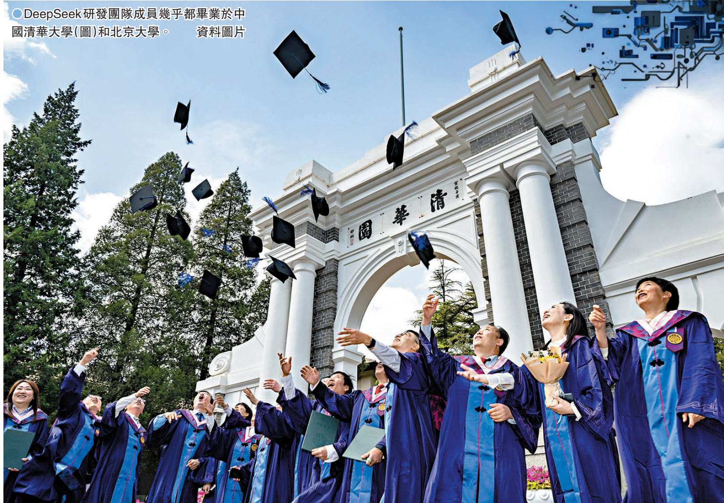
○DeepSeek研發團隊成員幾乎都畢業於中國清華大學(圖)和北京大學。

BBC新聞事務行政主任圖爾內斯警告稱，研究結果凸顯現有AI聊天機械人難以在不曲解事實的情況下，提供準確及時的最新資訊，呼籲AI企業與新聞機構加強合作。