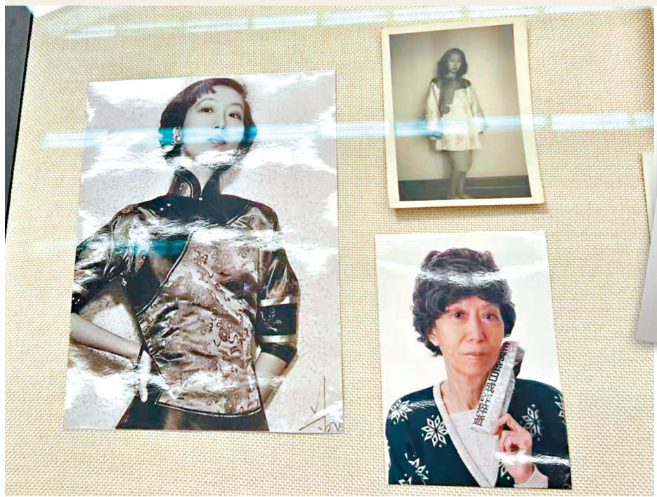
▲張愛玲《南北喜相逢》劇本封面。 ▲獲贈的物品包括張愛玲的照片，除了較經典的個人照，亦有她較為年長時的照片。

2025年是張愛玲辭世30周年。這位出身上海、移居香港，最後長年居於美國的女作家，其代表作《傾城之戀》《半生緣》等時至今日仍為人所津津樂道。香港都會大學（都大）昨（12）日獲贈數千件張愛玲、宋淇及宋麗文美手稿遺物。通過遺物，人們對於張愛玲的了解可以更加豐富鮮活。手稿、信件、照片，一筆筆由張愛玲親手書寫的文字，拼湊出了她生活的點滴碎片。這其中，有張愛玲喜愛占卜用的「牙牌籤」，也有她託宋麗文美幫忙在香港訂製旗袍的手繪設計圖，而張愛玲向摯友安排遺產的信件，更是讓人動容。