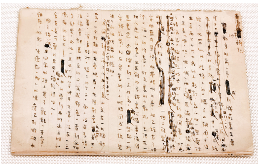
●張愛玲《異鄉記》手稿。

作為張愛玲至交好友宋淇夫婦之子，宋以朗從父母手中接手處理張愛玲遺產已長達20多年。他表示，因年事已高，擔心如此多的遺產手稿難以妥善處理，畢竟個人的專業性不足。張愛玲與宋淇夫婦有諸多書信往來，思考良久，他決定將其和父母的書信及遺物一同捐出。今次的捐贈幾乎涵蓋張愛玲及宋淇夫婦的所有手稿及書信，有部分從未曝光，校方表示接收的文物超過60箱。張愛玲與宋淇夫婦長達40年的書信交往，單是信件字數已逾60萬字。談及此，宋以朗為張愛玲和父母的友誼動容，坦言「十分羨慕」。