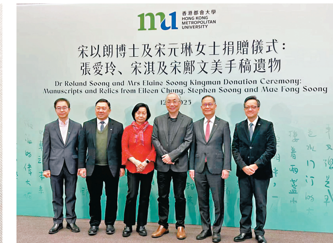
●香港都會大學舉行張愛玲遺產捐贈儀式。