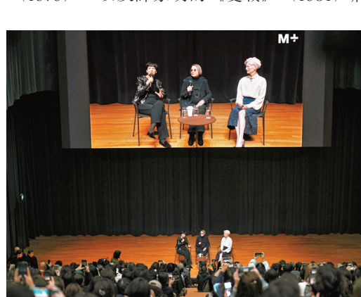
●蒂達史雲頓與唐書璇在M+對談現場。

「M+修復」項目在2023年7月已啟動對九部香港新浪潮電影的修復工作。其中3部作品，包括唐書璇的《董夫人》（1968）、翁維銓的《行規》（1979），以及譚家明的《愛殺》（1981）將於今年內完成修復，並於各大國際電影節作首映。這些誕生於香港新浪潮時期的電影，有自己獨特的風格特徵，並對後來的香港電影有着深刻的影響，而對老電影的修復，則可助力其影響力再度穿越時間，和新世代的年輕人碰撞而產生全新的奇妙可能。