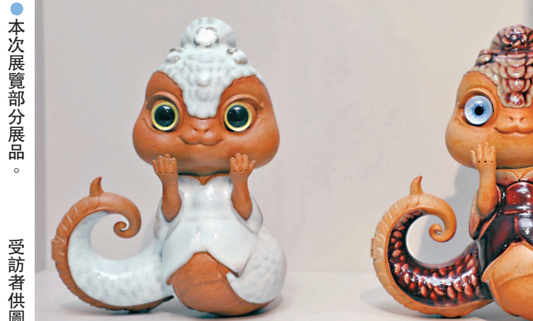
●本次展覽部分展品。

10年來，中國歷代陶瓷蛇生肖主題系列展已不僅是陶瓷藝術界的盛會，更是對傳統文化的傳承創新和現代表達做出的生動實踐，推動傳統文化與現代創意的交融，展現中國陶瓷生肖藝術的獨特魅力，傳承和弘揚中華民族的優秀傳統文化。平頂山學院黨委書記華小鵬指出，相信通過陶瓷蛇生肖主題系列展，不僅能使觀眾領略陶瓷藝術的非凡魅力，更能深刻感受中華民族傳統文化的深厚底蘊和勃勃生機。希望此次主題展覽能夠營造歡樂祥和的節日氛圍，讓更多的觀眾感受到中國陶瓷藝術的博大精深和獨特魅力。今次展覽將直至5月22日。