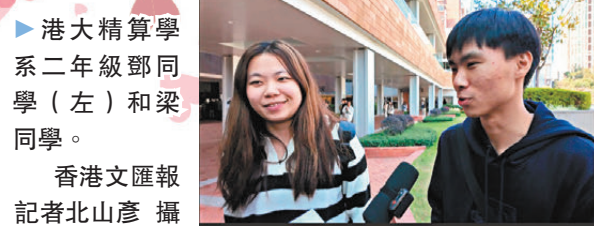
●港大精算學系二年級鄧同學(左)和梁同學。