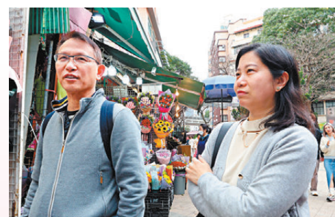
●市民陳先生和太太幫身在外地的兒子買鮮花給女友。

他指，情人節前幾日的預訂情況不是很熱烈，相信市民傾向情人節當日即買買花，「情人節比起母親節及父親節的銷售情況更強，而在情人節，玫瑰仍然是首選。」他估計今年銷售額按年升約一