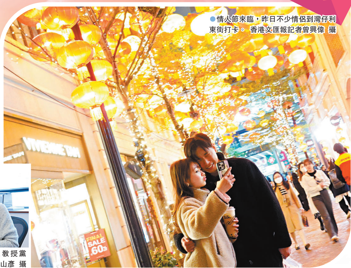
●情人節來臨，昨日不少情侶到灣仔利東街打卡。

——年一度情人節又到，近年網上交友平台成為不少人實現愛情的工具，但這些平台均面對用戶偏好差異、匹配效率低等諸多挑戰。專注計量市場學的黨蠡，與香港中文大學及澳門大學研究人員以內地大型交友網站的數據進行分析，通過探究信息於平台匹配中的作用，揭示用戶選擇如何受影響，研究結果早前已在《資訊系統研究》發布。她日前對香港文匯報分享說，有關發現不僅對使用者個人幸福有意義，對平台優化亦有實際價值。