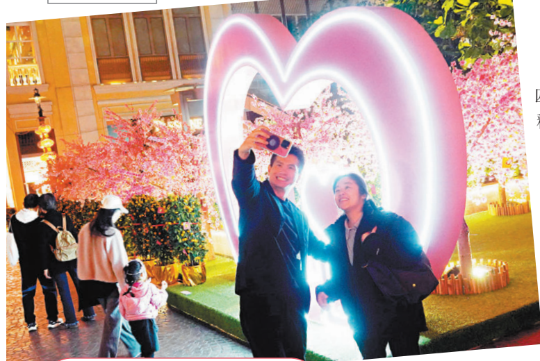
●情侶留住美好時刻。