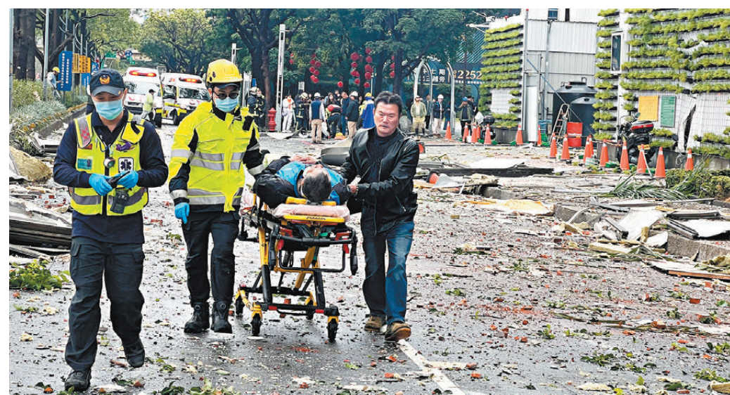
●截至晚間20時，事故共造成4人罹難、30人受傷。其中來自澳門的遊客一家七口兩死五傷，包括一名兩歲兒童須插喉搶救，其他家人僅擦傷無大礙。