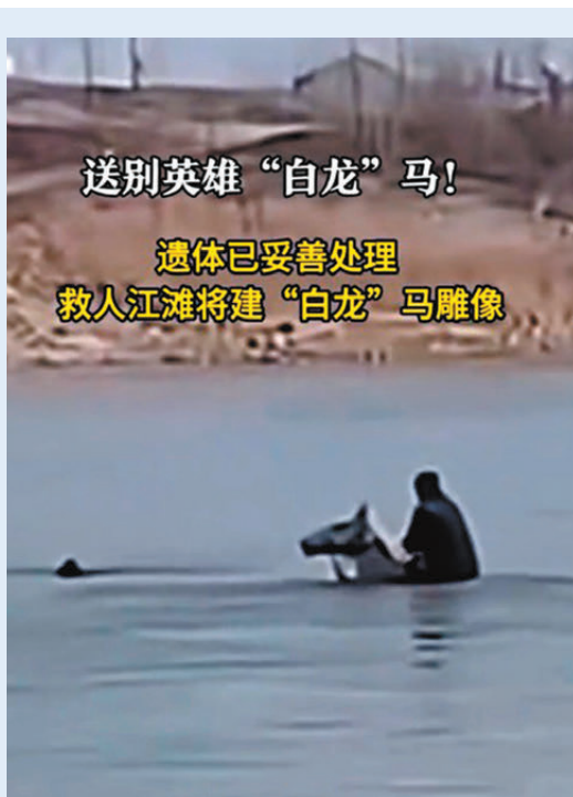
●2月4日下午，在漢江湖北仙桃段，「白龍」馱着主人游出40多米，最終與其他幾名熱心救援人士合力成功救起落水父女。白馬生病離世後，網友哀悼其俠義長存。 視頻截圖

「白龍」的離世引發了全網哀悼。在微博，「#英雄白馬一路走好#」話題閱讀量超3億，抖音上相關視頻的播放量破17億，還有不少人專程前往漢江邊送花弔