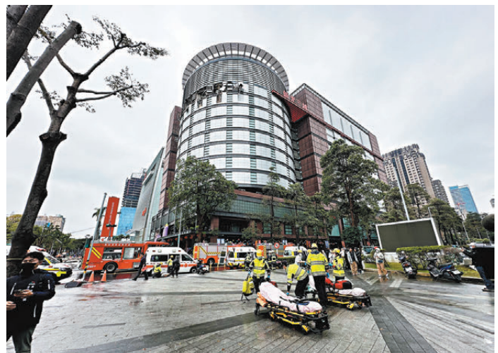
●氣爆發生後，消防局立即派員到場救援，事故原因仍待進一步釐清。