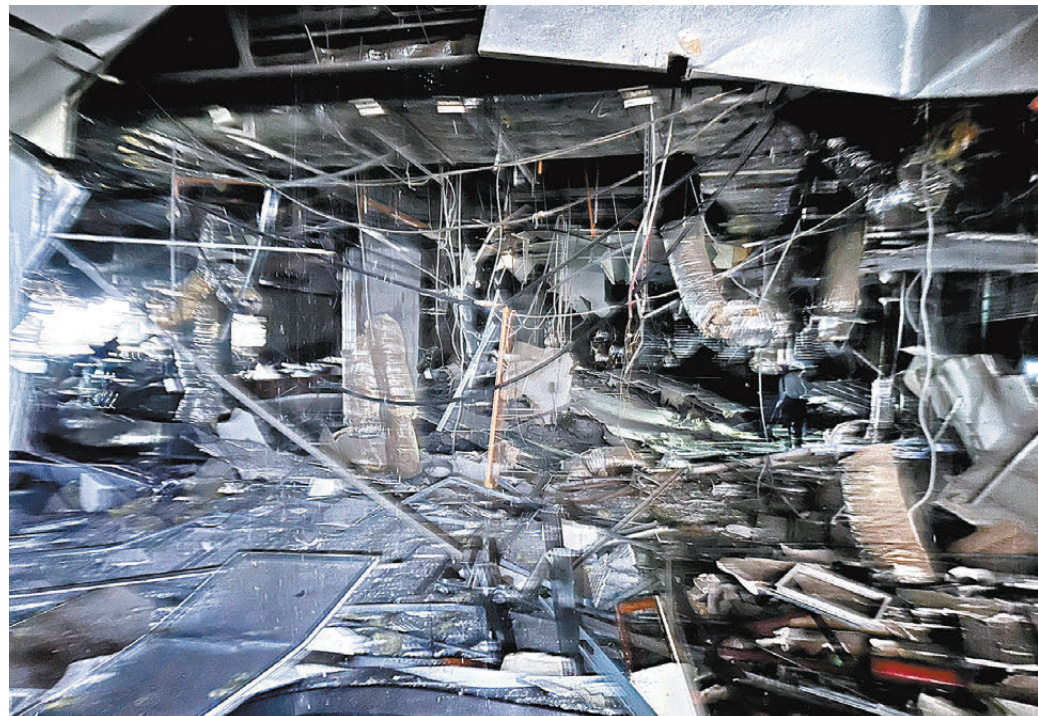
●台中新光三越百貨大樓13日發生氣爆，現場一片狼藉。 中央社

台灣媒體關注到事故登上大陸微博熱搜第二名，並報道了不少大陸網友的暖心留言，包括「祈禱平安」「看得人心慌，真是無妄之災」「應該又是燃氣爆炸吧……威力那麼大，用氣安全真的很重要啊」等。