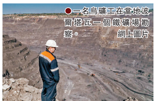
●一名烏礦工在當地波爾塔瓦一個鐵礦場勘察。

香港文匯報訊 美國財長貝森特周三(2月12日)抵達烏克蘭首都基輔，成為特朗普政府上台後首名訪烏的內閣部長。路透