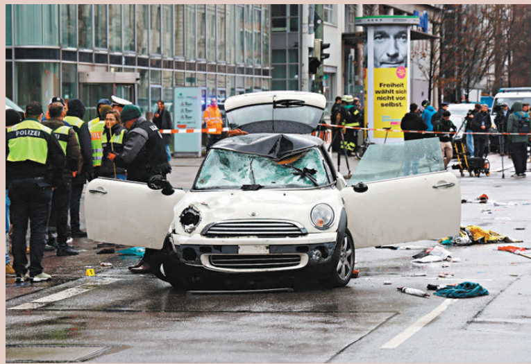
●慕尼黑一輛Mini Cooper撞向人群，警察在場搜證。