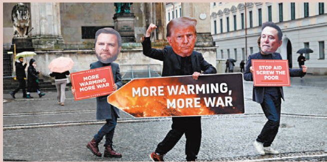
●示威者戴上面具，在慕尼黑市中心舉行抗議活動。

在關於美國的章節部分，報告稱「特朗普主義很可能會開創美國外交政策的新時代」，指出歷屆美國總統堅信美國是維繫世界不可或缺的國家，而特朗普主義與之存在根本性分歧，他的願景缺乏對國際秩序的責任感，特朗普對格陵蘭、巴拿馬和加拿大的主權威脅，顯示他並不認為自己受到主要國際規範約束。這對合作安全架構已稀碎的歐盟來說無異於雪上加霜，特朗普挑起的關稅爭端，也會讓歐盟經濟模式面臨的壓力升級，同時特朗普政府也可能助長歐洲內部的民粹主義運動。