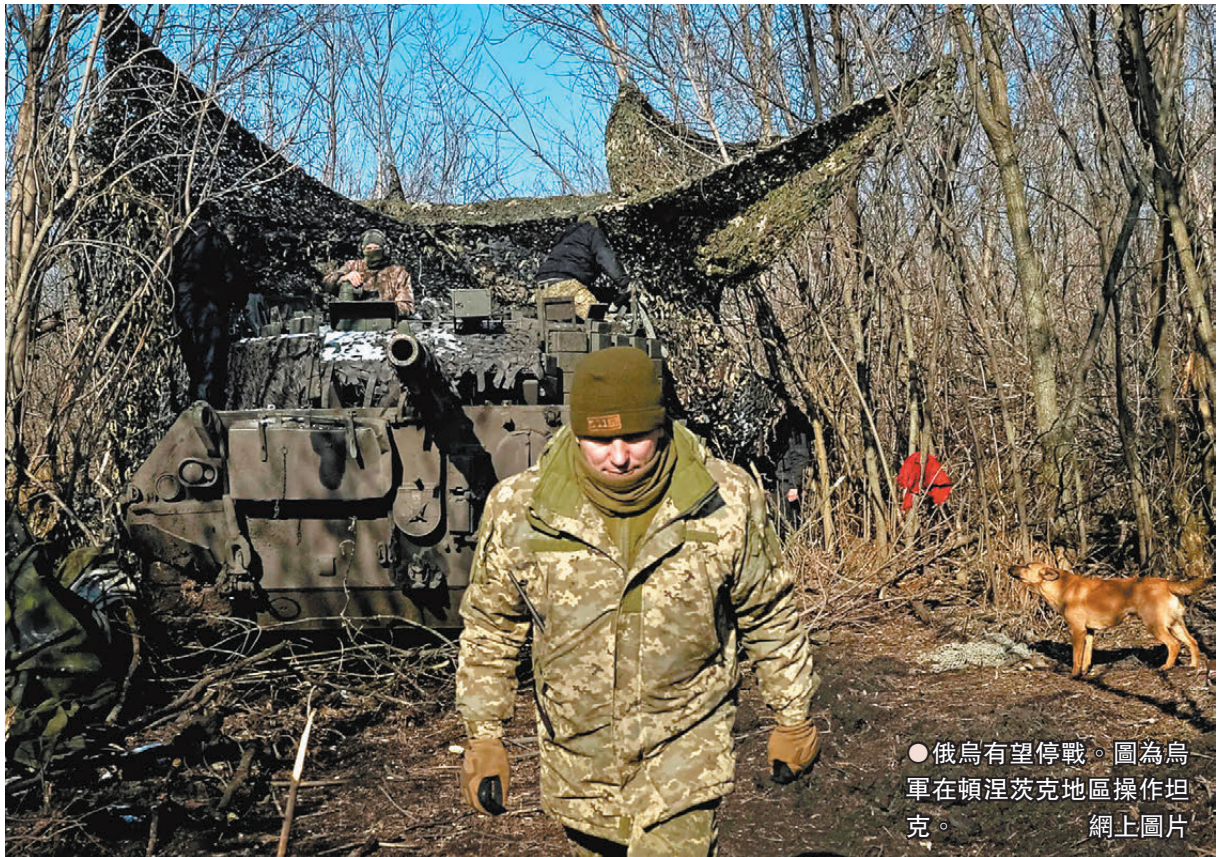
●俄烏有望停戰。圖為烏軍在頓涅茨克地區操作坦克。

香港文匯報訊 美國總統特朗普周三(2月12日)宣布，他當天與俄羅斯總統普京通電話，雙方同意就俄烏衝突恢復和談，指示雙方團隊立即開始談判工作。特朗普還稱，他將與普京在沙特阿拉伯會面。俄羅斯克里姆林宮證實，普京已邀請特朗普訪俄。今次是2022年俄烏衝突爆發以來，俄美雙方首次進行最高級別通話，《金融時報》形容此舉意味俄美關係發生戲劇性轉變，亦有跡象表明美方將減少對烏克蘭的支持。