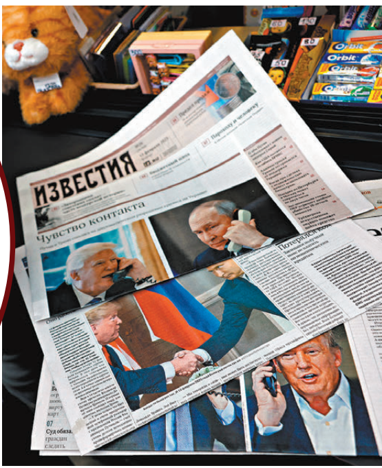
●俄媒大肆報道普京和特朗普通話的消息。

郭嘉昆說，關於烏克蘭危機，中方始終認為對話談判是解決危機的唯一可行出路，始終堅持勸和促談。中方支持一切有利於和平解決危機的努力，將繼續有關各方保持溝通，持續為推動危機政治解決發揮建設性作用。