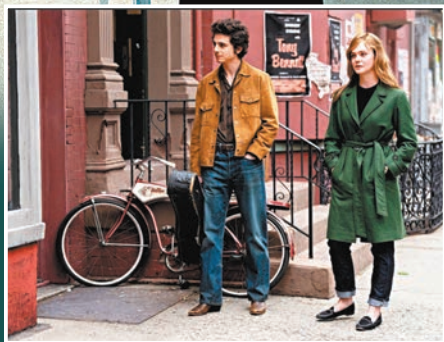
●艾麗芬寧飾演卜戴倫年輕時代的女友蘇斯羅素。