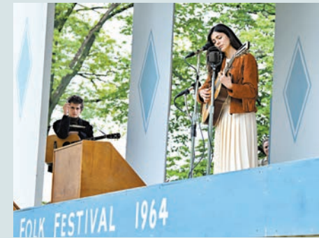
●蒙妮卡巴露飾演民謠歌后鍾拜雅斯。