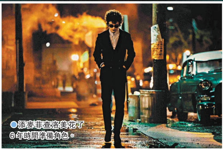
●添麥菲查洛美花了6年時間準備角色。