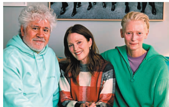
●艾慕杜華同片中兩位女主角達史雲頓(右)及茉莉安摩亞(中)合照。

艾慕杜華這一生都在瘋狂探討人性，以禁忌作為語言。在《隔壁的房間》中，他深入探討了孤獨、隔離和人際關係的脆弱等問題，這些主題在艾慕杜華的作