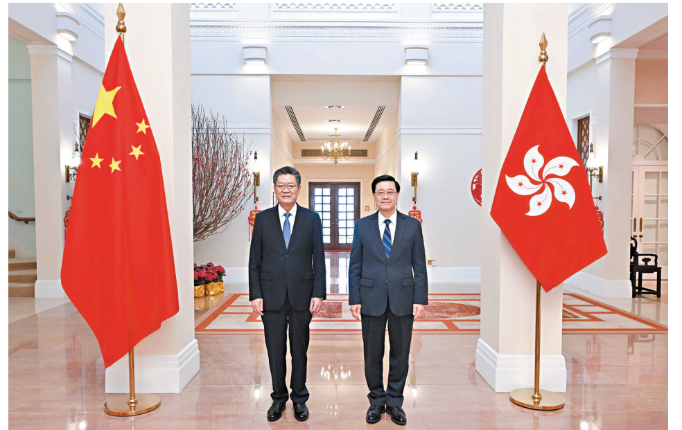
●李家超（右）在禮賓府與郭永航（左）會面。

香港文匯報訊 香港特區行政長官李家超昨日在禮賓府與廣州市委書記郭永航會面，就深化香港和廣州市合作交流意見。