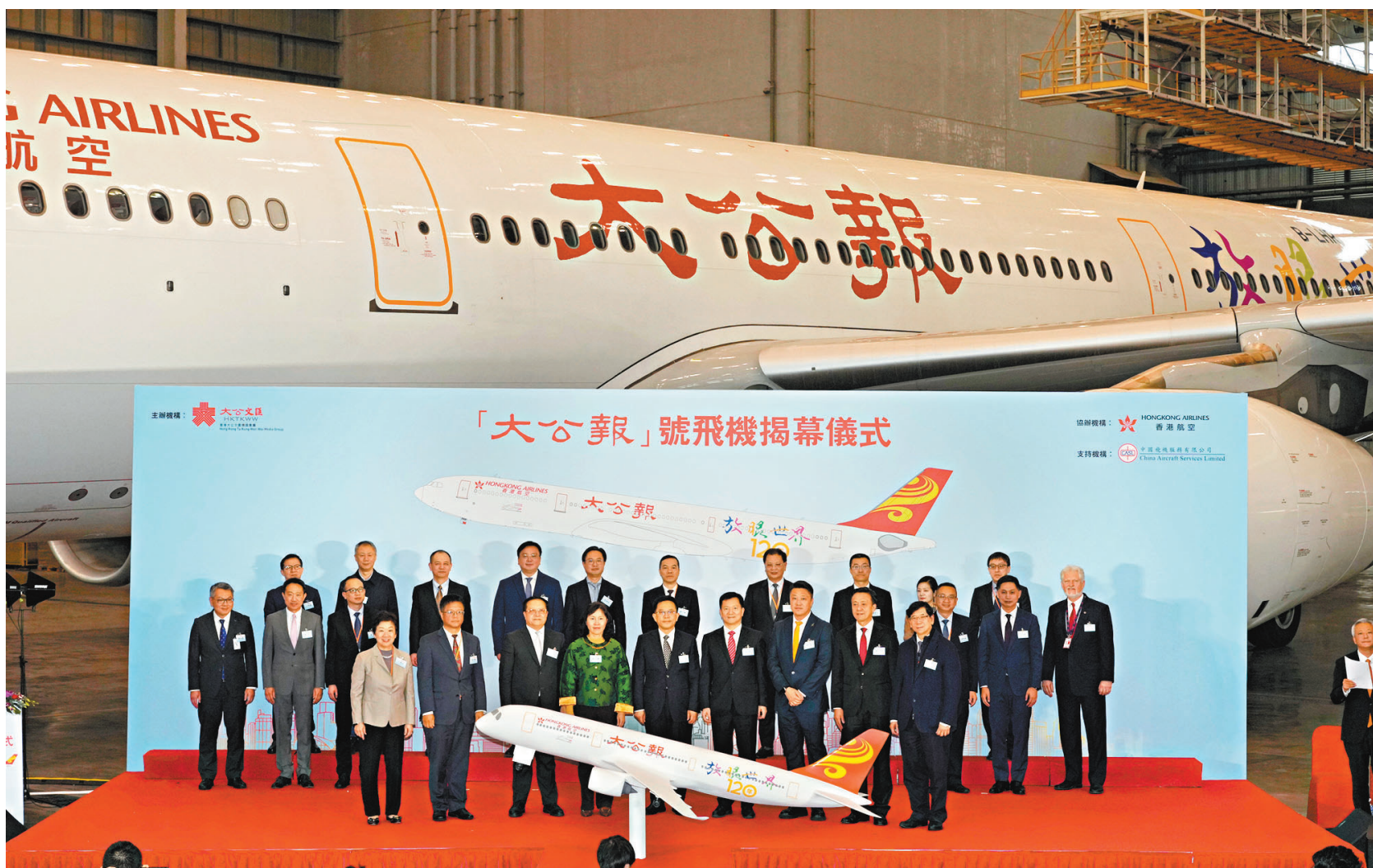
●「大公報」號飛機揭幕儀式，昨日在香港國際機場隆重舉行。