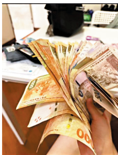
港碩兼職「這個月工資結算 算上內陸的小生意 還有他媽媽每個月給的生活費 在香港很开心啦!! 感興趣的同學可以pm 現在公司正在招聘員工 可以找我內推囉