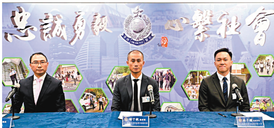
●警方交代「黑火」行動瓦解了一個由黑社會操控的犯罪集團案情。

警方在詐騙集團的辦公室搜出所謂「代理人佣金計劃書」，騙徒聲稱只要「代理人」做到一定業績，例如「營業額」達1,800萬元，便可以獲得25%佣金，即大約465萬元；若「營業額」達1.36億元，便可以獲得40%佣金，即大約5,456萬元。騙徒安排所謂「代理人」在社交平台發帖炫耀金錢以及名錶名車，以高佣金方式引誘「港漂」學生做中介人，協助推銷租盤及帶受害人去看樓。據悉，有一名經中介公司租樓的「港漂」學生，被騙徒遊說加入中介人行列，並在本案中被拘捕。