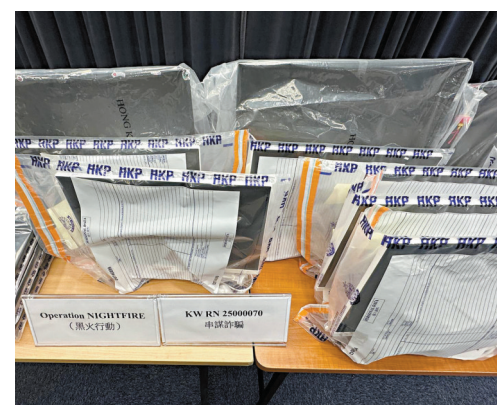
▲警方在「黑火」行動中檢獲的電腦等證物。