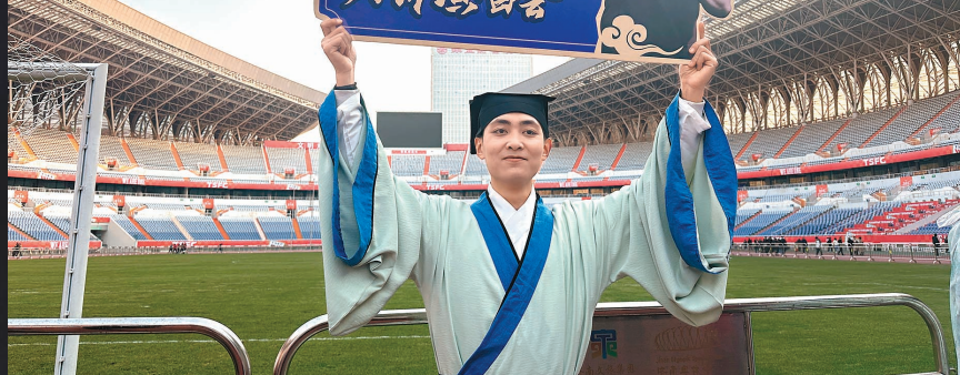
●來自淄博聊齋城的「刀迷」舉牌支持刀郎。

「每當我聽到他的音樂出來，二胡的聲音、笛子的聲音，簡直就是那種柔腸的感覺。你仔細聽進去會覺得它特別地深入人心，很多次聽