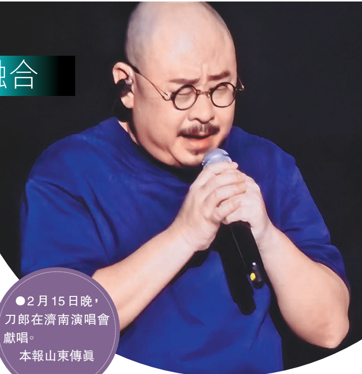
●2月15日晚，刀郎在濟南演唱會獻唱。

在演唱會前夕，刀郎特意前往淄博低調拜訪了蒲章俊。蒲章俊將《聊齋誌異》的康熙抄本第十一號贈送給刀郎，以此向其專輯《山歌