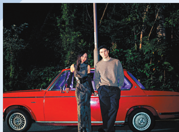
●江海迦十分欣賞鳳小岳。