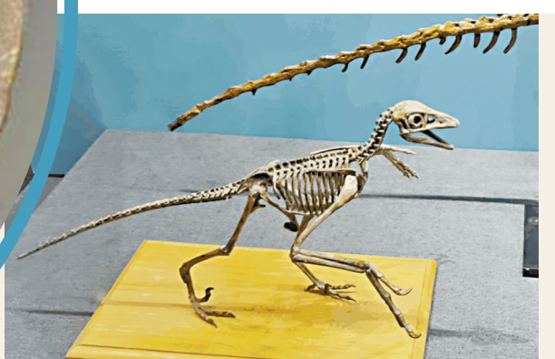
●原始熱河鳥的化石揭示了「從龍到鳥」的演化過程。