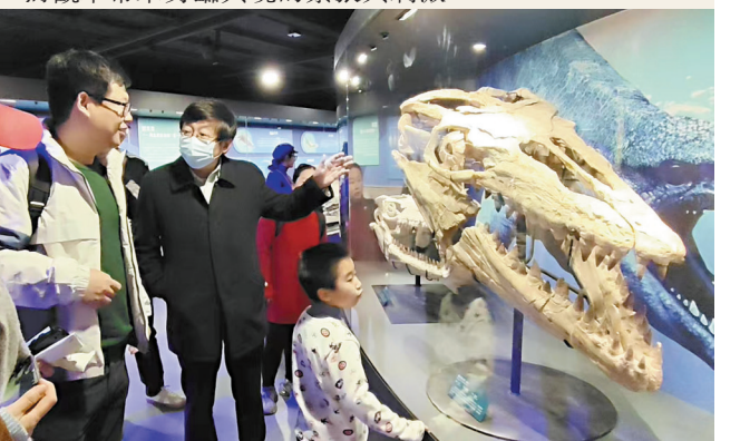
●生存在白堊紀的霍夫曼滄龍是體長可達15米的海洋兇殘獵手。