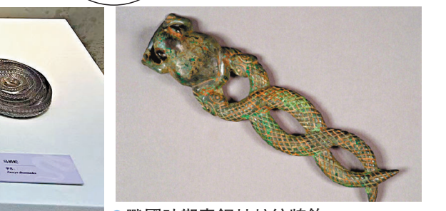
●戰國時期青銅蛙蛇紋牌飾。

「蛇舞雙年」單元，唐代的「靈蛇獻珠」屏風畫、現代的十二生肖巳蛇剪紙等圖片作品，將蛇在民間文化中的吉祥寓意展現得淋漓盡致。據介紹，在中國豐富多彩的民間工藝美術品中，蛇以其獨特、神秘、優雅的形象，成為匠人們創作靈感的不竭源泉，折射出中國人對美好生活的祈盼與追求。