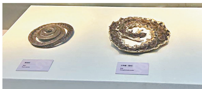
●收載入現行中國藥典的3種蛇類的標本。

在漢代，蛇鈕製印還常作為中央政府賜給偏遠地區官員或者番邦君王的官印，和龍印一起構成明顯的等級劃分。雲南博物館收藏的一枚「滇