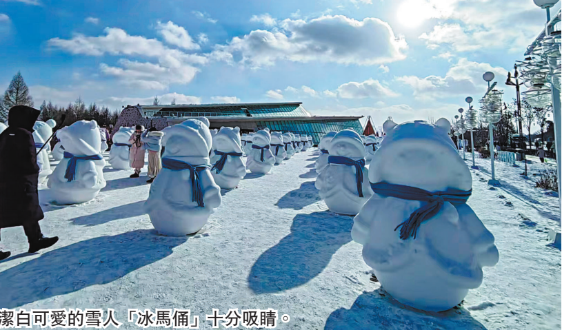
●潔白可愛的雪人「冰馬桶」十分吸睛。