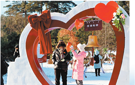
●情侶在美人松愛情森林打卡。

在二道白河小鎮，滿街的雪人是對遊客的寵愛，有網友評論，這是東北冬季限定禮物，堪稱是最有排面的冬日驚喜。其地點位於長白山雪絨花冰雪樂園內，一排排的潔白可愛的雪人「冰馬桶」十分吸睛，上百個憨態可掬的雪人齊聚雪地，在陽光的映照下顯得格外耀眼，雪人大小各異，大的雪人比成年人還要高，小的雪人寶則只有一米左右，適合各個年齡段合影拍照，這裏是親子遊的最佳打卡點，大朋友和小朋友們穿梭在雪人之間，歡聲笑語不絕於耳。