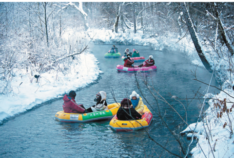
●冬日裏的霧凇漂流雖然冷，但是兩岸風景別具一格。

冬日裏，小鎮上處處都是打卡點，拍出的照片滿屏都是高級的藍白色雪景。在這裏生長着的地標植物是美人松，其時美人松公園深綠色的松枝上還掛着雪，木棧道一路延伸到岸邊溪流，隨手一拍，就是大片。鎮上的雪絨花主題公園，是情侶的打卡勝地，浪漫的留影牆、乖巧溫馴的馴鹿、可愛的雪人，都是打卡點。不遠處的「冰封玫瑰」盛放着，洞頂呈愛心形狀超浪漫。