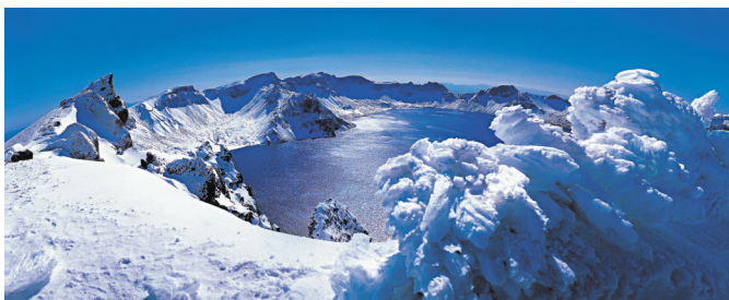
●冬季落雪後的天池神秘壯觀。

想在冬日裏一睹天池的真容，是需要遊客的運氣，也需要提前做好天氣的攻略，最好選在連續多日的晴天，登山後，每天看見天池的最佳時間段，就在早晨的10到11點，大風吹過雲霧散開，方顯真容。