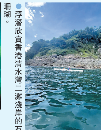
●浮潛欣賞香港清水灣二灘淺岸的珊瑚。

往礁石北邊游過去，海底好深，礁石上長滿水草和貝殼，再轉過礁石往岸邊游，看見海膽、海螺，又有五彩的魚兒游來游去。這時我浮出水面，看見