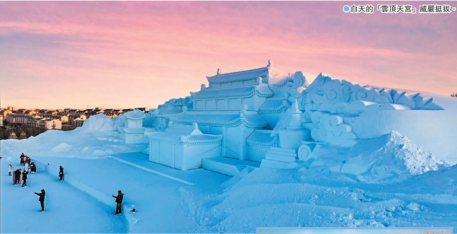
●白天的「雲頂天宮」威嚴挺拔。