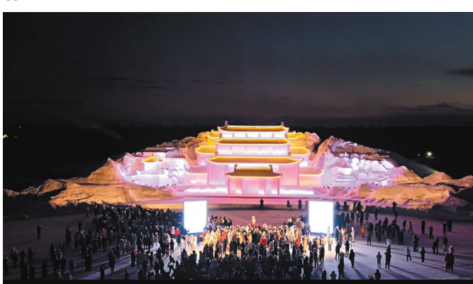
●晚上的「雲頂天宮」更顯神秘。

在南派三叔的《盜墓筆記》中，雲頂天宮是由汪藏海在長白山中設計建造，是一座無法用語言來描述的漂浮在天上的宮殿。今年，雲頂天宮和青銅門大型雪雕正式面向遊客開放。此次雲頂天宮佔地面積1萬餘平方米，主體高20米、寬60米，造雪量達8萬立方米。佇立於長白山脈，把原野裏無法用語言描述的天上宮闕從二次元搬進三次元。值得一提的是，每當夜晚，「雲頂天宮」雪雕點亮宮燈，氛圍更顯神秘。