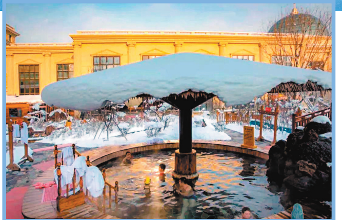
●冬日裏可在戶外溫泉體驗冰火兩重天樂趣。