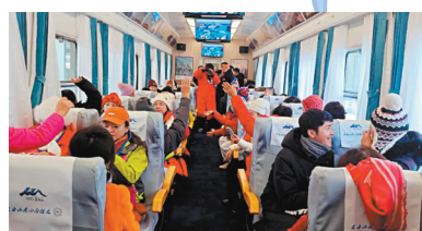
●遊客登上「雪國專列」。

當冬天的雪飄落在鐵軌上，那列正穿越雪景的列車，似乎變成了童話中的夢幻之車。作為連接長白山北西兩景區的重要交通紐帶，Y518次「雪國列車」以長白山北坡、西坡、南坡3個主景區為專列線路核心，一路穿越極致雪國，深入廣袤林海，沿途的風景如詩如畫，