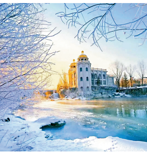
●冬日的二道白河鎮