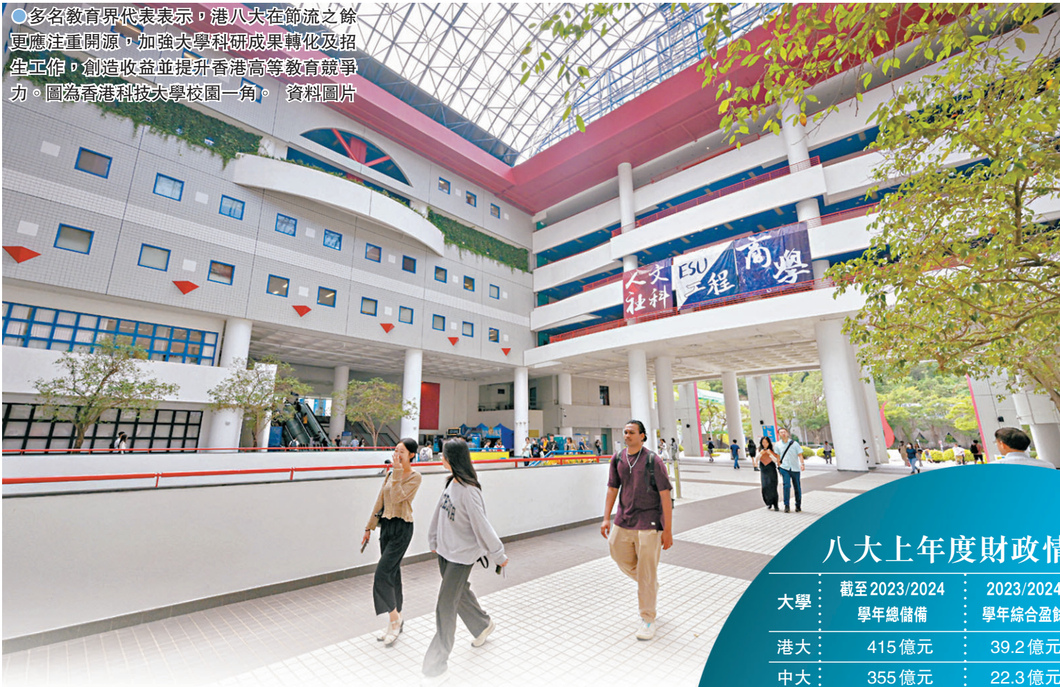
●多名教育界代表表示，港八大在節流之餘更應注重開源，加強大學科研成果轉化及招生工作，創造收益並提升香港高等教育競爭力。圖為香港科技大學校園一角。