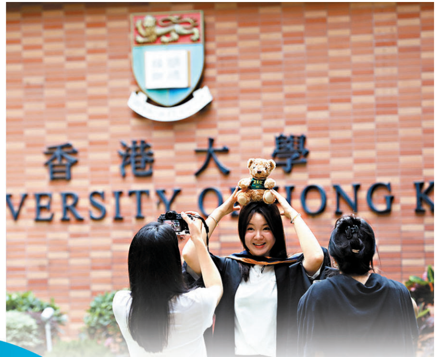
●多名教育界代表表示，特區政府在調整撥款時，應向大學提供指引，保證其用好盈餘儲備減低衝擊。圖為香港大學學生畢業前留影。資料圖片

香港特區政府面臨十億財赤，教育開支被點名為節約支出的對象之一，尤其是香港各所資助大學財政儲備豐厚，特區政府教育局已表明，會調整教資會每三年一度（2025年度至2028年度）的撥款。香港文匯報分析香港八間大學的最新財政情況，其總儲備近1,400億港元，年度盈餘總額亦近百億港元。另一方面，本港大學搵錢能力強，隨著新學年加學費以及擴招非本地學生，相關收入將持續增加。多名教育界人士日前在接受香港文匯報記者採訪時表示，特區政府在調整撥款時，應向大學提供指引，保證其用好盈餘儲備減低衝擊，而在節流之餘更應注重開源，進一步加強大學科研成果轉化及招生工作，創造收益並提升香港高等教育競爭力。