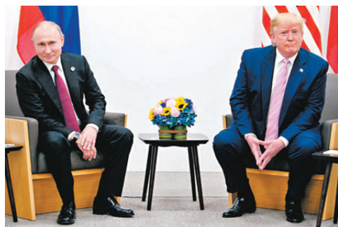
●美俄雙方均表示，兩國總統特朗普(右)與普京將會晤。

俄羅斯主權財富基金負責人德米特里耶夫表示，只有俄美共同努力才能化解全球衝突、提供解決方案，他預計俄方尋求取消西方國家制裁的談判，可能在未來數月有進展，但未說明詳情。