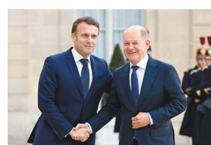
●法國總統馬克龍(左)與德國總理朔爾茨在會議前握手。

歐洲在今次俄烏衝突談判中被晾在一邊，德國最大國防承包商萊茵金屬(Rheinmetall)行政總裁帕珀格爾認為歐洲現時境地，是常年在自主建立國防方面投資不足的後果，「如果你不夠強大，他們(指美俄)就會像對待幼童一般對待你。」