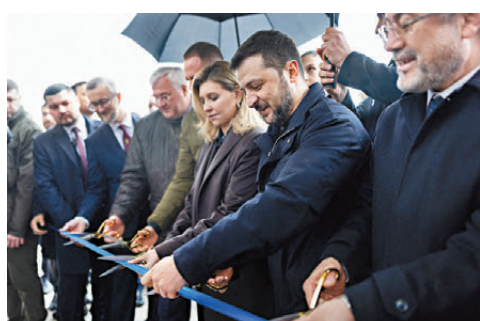
●烏克蘭總統澤連斯基(右二)到土耳其出席烏大使館剪綵活動。