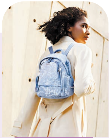
● TUMI 全新春季系列

而且，今年的春季系列向秘魯壯麗的風景與璀璨的文明致敬，選用繽紛多彩的色調呈現品牌經典，包括 Voyager、Georgica、Alpha Bravo、19 Degree 等系列的精選產品。系列集時尚與實用於一身，以牛仔布、紅色或石灰色變色龍和自然或流沙等鮮艷配色，搭配多款充滿季節色彩的吊飾，歌頌秘魯的自然美景。