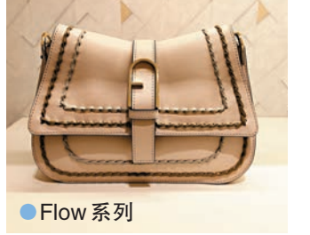
● Flow 系列