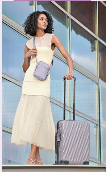
● 蔡徐坤演繹 Versace 主要服裝造型