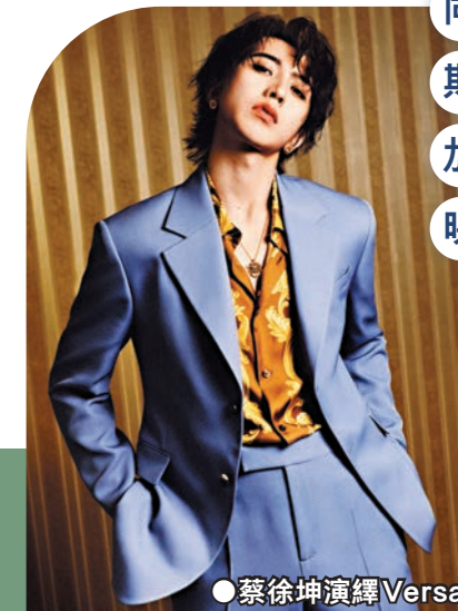
● 蔡徐坤演繹 Versace 主要服裝造型

例如，在最新的 Nuvola 系列中，其中金屬細節呈現為手柄上的雙 Arch 編織花紋，專為手提而設計，系列色彩選擇豐富，既有經典百搭的黑白相間、小蒼蘭黃與杜鵑花紅粉，也有清麗新穎的辣椒橙與天青灰。Flow 系列則是實用功能