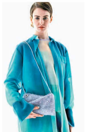
●從玻璃藝術汲取靈感的 WIREBAG