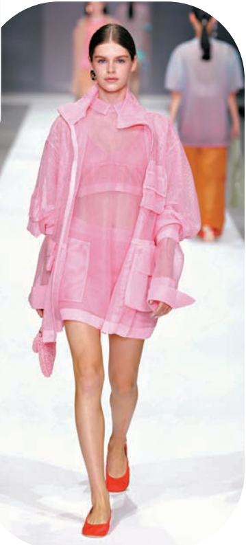
● ANTEPRIMA 2025 春夏系列