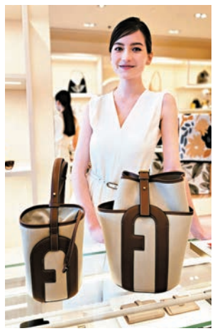
● Lido 系列

全新 FURLA 2025 春夏系列以夢幻經典意式假日為靈感，重現文藝復興時期興起的威尼斯「鄉村度假」傳統，系列還捕捉了夏日度假的色彩氛圍：散發泥土氣息的海濱暖色、遍野勃勃生機的浪漫花色、海面波光閃閃的藍綠水色。系列精選天然材質，經過細緻手工製作，凝聚傳統意大利工藝的精妙匠心。今季袋款是優雅的象徵，線條柔軟，皮質高雅，輪廓流暢，並點綴以個性十足的小巧鑲飾，引領大家進入魚兒、螃蟹、鯨魚和多彩花卉譜寫的夢幻海洋。