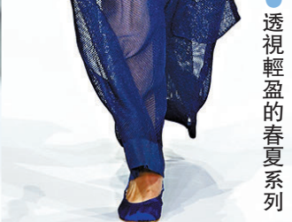
透視輕盈的春夏系列