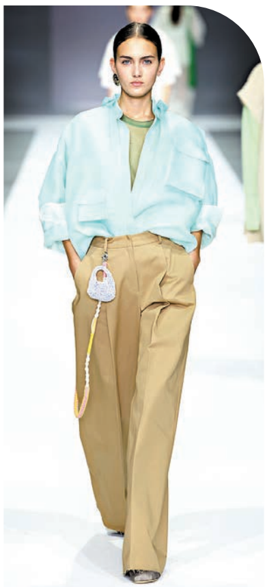
◀▲ PALLONCINO WIREBAG 變化成迷你吊飾。