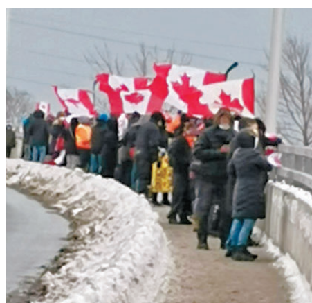
● 特朗普關稅威脅激發加拿大人愛國，國旗銷量激增。

加拿大先期廢棄的管道項目包括能源東部管道(將石油從資源豐富的艾伯特省輸送到4,600公里外的大西洋海岸)和北方門戶管道，政府目前正在討論重新發展，尋找更遠方的新貿易夥伴。艾伯特省省長史密斯把特朗普描述為喚醒加拿大的「警鐘」，並認為新的管道項目有助國家石油產量倍增。魁北克省目前沒有計劃恢復穿越魁北克省的能源東輸油管，但特朗普的所作所為足可令魁省改變看法。聯邦自然資源部長威爾金森承認可能需要建造新西東石油管道，因為過度依賴美國石油出口是一個弱點。