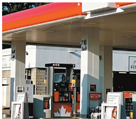
● 石油成為加拿大在貿易戰中的重要武器。