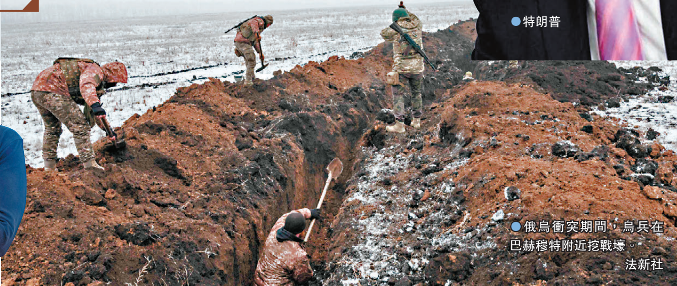
● 俄烏衝突期間，烏兵在巴赫穆特附近挖戰壕。

對於歐洲國家派兵烏克蘭的可能性，法國總統馬克龍周二表示，法國不準備向烏克蘭派遣地面部隊。馬克龍說，在接下來的談判過程中，「只要時機合適」，他準備與普京通電話。