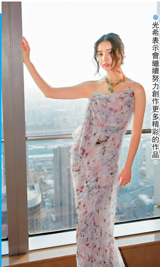
● 光希表示會繼續努力創作出更多精彩的作品。

近期，光希繼續衝出國際，主演英國電影《Tomado》。故事背景設定在18世紀的英國，講述一位日本布袋戲賣藝少女在逃離黑幫追殺中展開的驚險旅程。這是她首次挑戰武打戲份，柔中帶剛的表演風格令人耳目一新。該片將作為格拉斯哥電影節的開幕電影，於2月在蘇格蘭舉行全球首映。