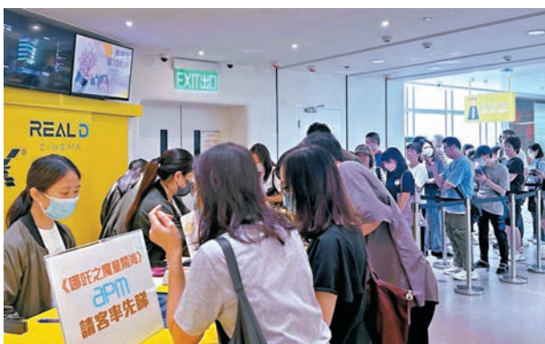
● apm商場包場請顧客睇《哪吒2》。

潮流，推出「《哪吒2》請客率先睇」獎賞活動，顧客昨日起於apm或大埔超級城消費滿$1,000，即可換領2月22日《哪吒2》電影票兩張，於電影開畫日憑票於B+ Cinema apm或嘉禾大埔欣賞《哪吒2》指定場次，一起沉醉於《哪吒2》的東方奇幻美學之旅。