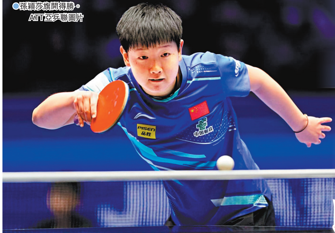
●孫穎莎旗開得勝。

第34屆國際乒聯-亞乒聯盟亞洲盃昨日(19日)假深圳開賽。其中孫穎莎在首場分組賽以3:0橫掃中國台北選手簡彤娟,收穫本屆乒乓球亞洲盃的「開門紅」。隨後,男單世一選手林詩棟以3:0的比分戰勝港隊一哥黃鎮廷,同樣拿到小組賽首勝。 ●香港文匯報記者 李薇、胡永愛