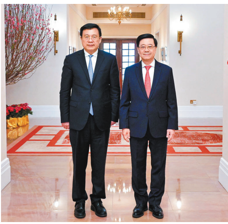
●行政長官李家超昨日在禮賓府與新華社社長傅華（左）會面。

李家超在會面中表示，新華社作為中國的國家通訊社，擁有覆蓋全球的新聞資訊採集網絡，是極具影響力的世界級媒體。他感謝新華社多年來積極報道香港新聞，包括特區政府的重大政策和措施，把特區最新和最準確的資訊快速和專業地傳遞到世界各地，讓海外人士包括企業、投資者、人才和遊客了解到香港的發展實況，準確認識香港的真實和正面形象。