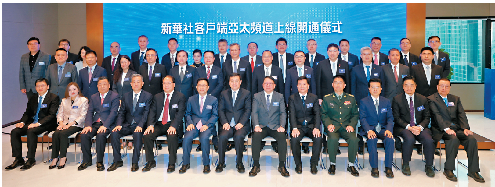
新華社客戶端亞太頻道上線開通儀式

●新華社客戶端亞太頻道昨日正式上線開通。亞太頻道將立足香港、面向地區、輻射全球，講好中國故事、傳播中國聲音，為對外展現中國形象打開一扇新「窗口」。