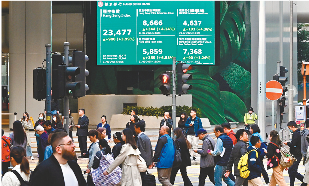
●科指單日狂升6.53%，帶挈恒指勁升900點，收報23,477點，創出3年新高。