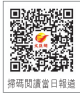
掃碼閱讀當日報道

生命迸發出新的活力，讓愛繼續……致敬器官捐獻者！」「看哭了，謝謝捐獻者小朋友和爸爸媽媽，希望小天使的生命以新的方式延續下去，全程參與接力的團體和白衣戰士們，就像精密儀器裏的齒輪般協同轉動，才能爭分奪秒救回一個生命，真的太棒了」「祈祈說：我命由我不由天，堅強的生存意志讓我得以重生。更加讚賞捐獻者的母親，當她聽到自己的孩子心臟再次跳動，也感到安慰！也感謝兩地各部門人員爭分奪秒的無私緊密合作。」