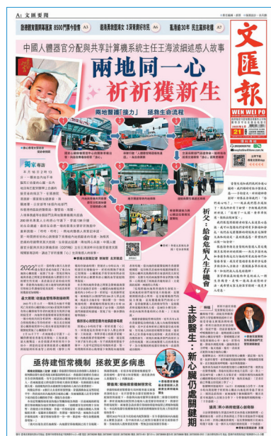
「祈祈換心」的相關報道在文匯全平台引發熱烈回響。