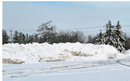
●加拿大嚴冬冰天雪地，戶外活動停頓。

另外，佛羅里達州近年多次遭到嚴重的風暴和颶風吹襲，導致當地房產保險費飛漲，保險費從每年數千美元升至1.6萬美元(約12.45萬港元)。除保險費外，房產稅和物業保養費用也大幅上