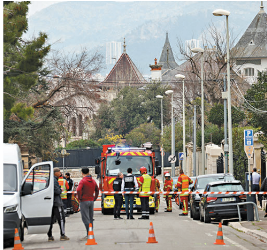
●法國消防員及警員封鎖領事館一帶。

事發於當地時間上午約8時，法國傳媒報道，襲擊者使用的燃燒瓶含有疑似易燃物，附近有一批可疑車輛，懷疑是被盜用來施襲。30多名警察和消防員在場參與調查，當局處理懷疑爆炸物期間，領事館員工均留在館內。法國外交部發言人稱，法方譴責任何侵犯外交機構安全的行為，強調外交和領事機構及其員工不可侵犯，保護相關機構完整性是國際法基本原則。