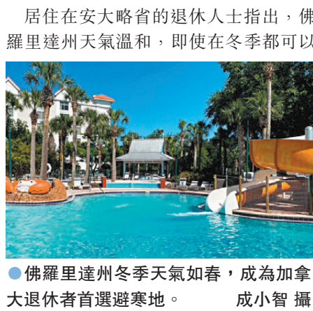
●佛羅里達州冬季天氣如春，成為加拿大退休者首選避寒地。

香港文匯報訊(特約記者 成小智 多倫多報道) 加拿大退休人士多年來選擇在嚴冬南下美國，前往佛羅里達州或加州暫住數月，避開零度以下的冰天雪地日子。不過，這批「候鳥族」今個冬季不再赴美避寒，加元兌美元匯價疲弱，推高他們在美國購買保險的收費、房屋保養和生活費，加上擔心美國總統特朗普可能對擁有美國房產的加拿大人徵收重稅，促使愈來愈多人變賣美國房產。