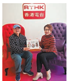
●堂哥人緣好，記憶力強。

堂哥人緣好，中氣足，記憶力強，在節目中還有很多秘聞分享，非常精彩。如果有興趣可以上香港電台節目重溫網站，收聽星期日剛播出專訪徐堂師傅的《舊日的足跡》。