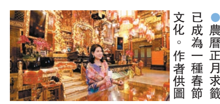
●農曆正月求籤已成為一種春節文化。

《道德經》有云「禍兮福所倚，福兮禍所伏」，禍與福——有時互相依存，有時互相轉化，無論求得什麼籤，只要我們能夠用平常心對待，以不變應萬變，自然可以化險為夷。