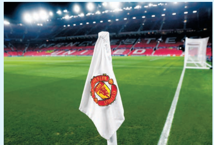
●奧脫福球場取消員工餐廳的午膳包餐福利。

曼聯本輪英超將主場迎戰倒數第三位的萊斯特城(Now625台周四凌晨3:30a.m.直播)，與曼聯境況差不多的熱刺則主場面對哀兵逆襲的曼城考驗(Now623台周四凌晨3:30a.m.直播)。