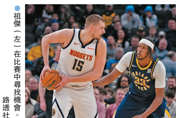
●祖傑(左)在比賽中尋找機會。

香港文匯報訊 綜合外電報道，昨日NBA(美職籃)常規賽，丹佛金塊憑藉王牌球星祖傑貢獻出18分、9個籃板、19次助攻的「準三雙」成績，作客以125:116擊敗印第安納溜馬，獨居西岸次席，其中祖傑單場19次助攻數更創其職業生涯的新高。另一方面，本月轉投洛杉磯湖人的「歐洲金童」當錫，將於本港時間今早11時代表新東家於主場首次倒戈對陣舊會達拉斯獨行俠。湖人總教練列迪克賽前表示，雖然「我知道這會(感覺)很怪，但他(當錫)會準備好的。」