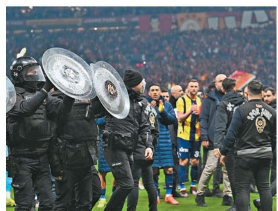
●賽事出動到大批防暴警察維持秩序。法新社

分，亦令今場大戰增添火藥味。雙方球員在賽前已拒絕握手，而比賽期間有一班球迷向對手的支持者投擲煙火棒，球證在52分鐘一度宣布暫停比賽。據報現場出動了大批警察維持秩序以防事態升級，並迅速控制了人群，讓比賽得以繼續。