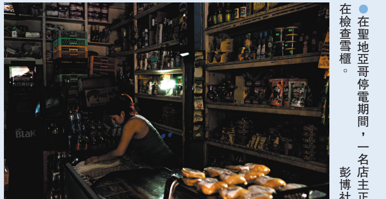
●在聖地亞哥停電期間，一名店主正在檢查雪櫃。

智利是全球最大銅礦生產國。這次停電影響範圍包括礦場密集的北部地區，主要銅礦場的營運亦受影響。消息人士稱，全球最大銅礦場埃斯孔迪達無電可用。智利國營銅礦公司則表示，旗下所有礦場都受到影響。