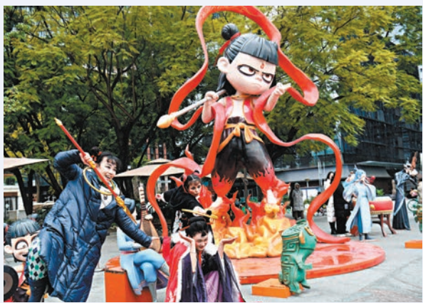
●《哪吒2》中的「魔童哪吒」形象同樣是身圍混天綾、手持火尖槍、腳踏風火輪。圖為市民與哪吒塑像合影。

網上圖片 仙，身長六丈，首帶金輪，三頭九眼八臂，口吐青雲，足踏盤石，手持法律。」書中又寫道：「托胎於托塔天王李靖」，其兄長是軍叱(金吒)和木吒(木吒)，又有「戰殺九龍」、「割肉刻骨還父」等事，後來《封神演義》顯然借鑒了這些情節。