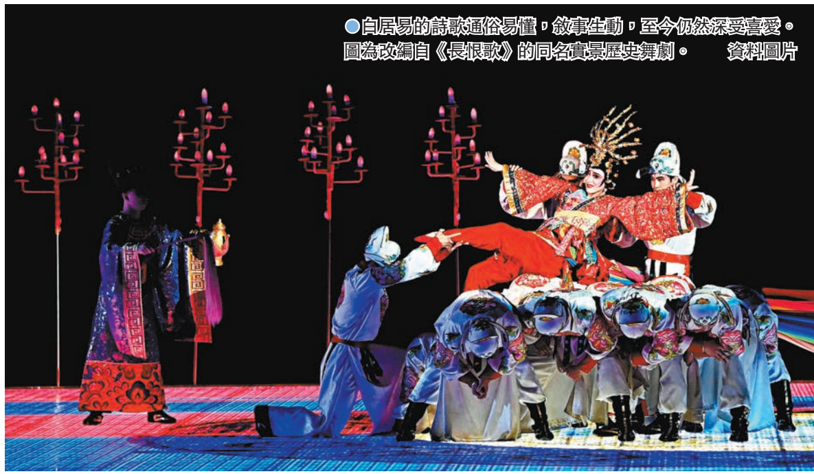
●白居易的詩歌通俗易懂，敘事生動，至今仍然深受喜愛。圖為改編自《長恨歌》的同名實景歷史舞劇。

至最後「天長地久有時盡，此恨綿綿無絕期」。寫玄宗苦思貴妃，以及貴妃在蓬萊宮中接見使者的情景。表現了兩人堅定的信念和可歌可泣的愛情。當然也對玄宗沉迷美色，只顧享樂而誤國進行批判。