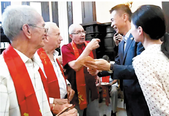
●曾赴華留學的古巴退役飛行員齊聚一堂共慶元宵佳節。圖為中國駐古巴大使華昕和古巴老兵。

「我的空軍同事翻閱了歷史檔案，走訪了當年教官，追尋那段激情燃燒的歲月。」吳謙在國防部例會上說，上世紀60年代，一批古巴飛行員在中國軍校接受培訓。在學習飛行的同