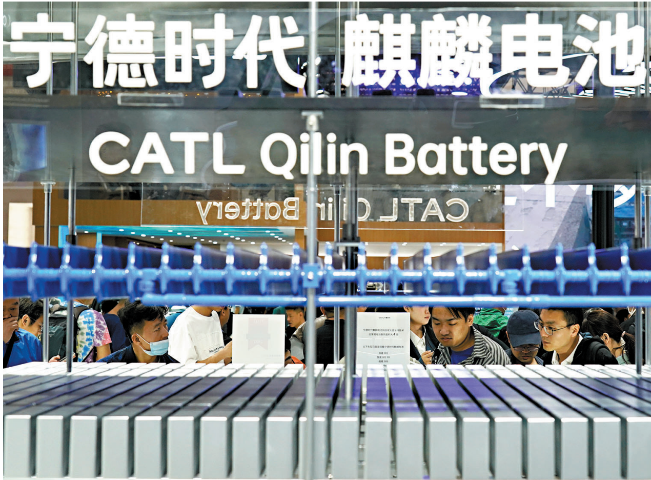
●寧德時代、新能源科技、廈錫新能源等企業三年內每年面向台胞提供100個以上就業崗位。圖為觀眾在2024北京車展寧德時代展區參觀。

香港文匯報訊（記者 蘇榕蓉 福州報道）為進一步關切台胞台企訴求，加快建設兩岸融合發展示範區，2月27日，福建省發布貫徹落實中央《意見》第四批政策措施，共計17條，涵蓋促進閩台服務業合作、支持對台農林漁業發展、支持在閩台胞更好發展三個方面。其中支持在閩台胞更好發展上，新政支持台胞到寧德鋰電行業就業發展。寧德時代、新能源科技、廈錫新能源等企業三年內每年面向台胞提供100個以上就業崗位。新政一經發布，引起台灣各界人士的高度關注，尤其是在台灣青年圈裏反響尤為熱烈。受訪台青向香港文匯報表示，科技大廠是科技發展的主陣地，當前越來越多的台灣年輕人都心儀到科技大廠發展，此次幾家企業都很先進，消息令人興奮，表示大陸科技大廠、創新型企業正成為台灣青年就業的新舞台、未來創新創業的新起點。