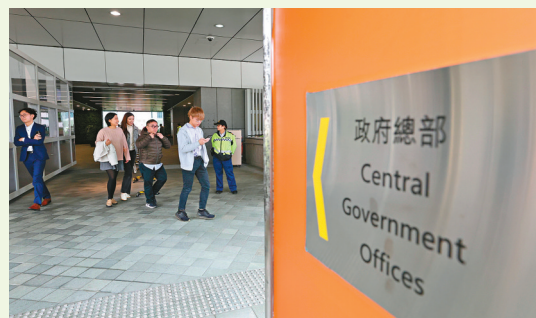
●公務員凍薪規模前所未有。圖為政府總部的公務員。

「各界對公務員團隊的期望和要求不斷提高，正如行政長官『沒有最好，只有更好』的施政理