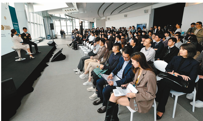
●國泰招聘體驗日吸引約900人參與。

為實現招聘目標，國泰將在全球積極展開招聘活動，包括一連三個月分別在香港、上海以及倫敦舉辦招聘日，以配合集團「植根香港、背靠