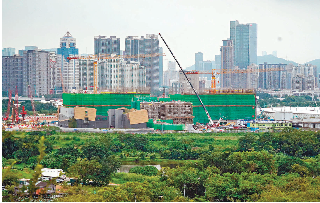
●陳茂波表示，倘單純為追求綜合賬目收支平衡而拖慢北部都會區發展並非合適的做法。圖為香港北都區新田馬洲一帶的用地。

陳茂波昨日接受電台訪問時表示，面對財赤，特區政府汲取了過往的經驗，不再過分依賴地價收入，加上以往每當地價及樓價飆升，市民壓力亦會隨之上升，因此不希望住屋像過往一樣供不應求時那般昂貴。特區政府會持續造地，何時推出會有彈性。