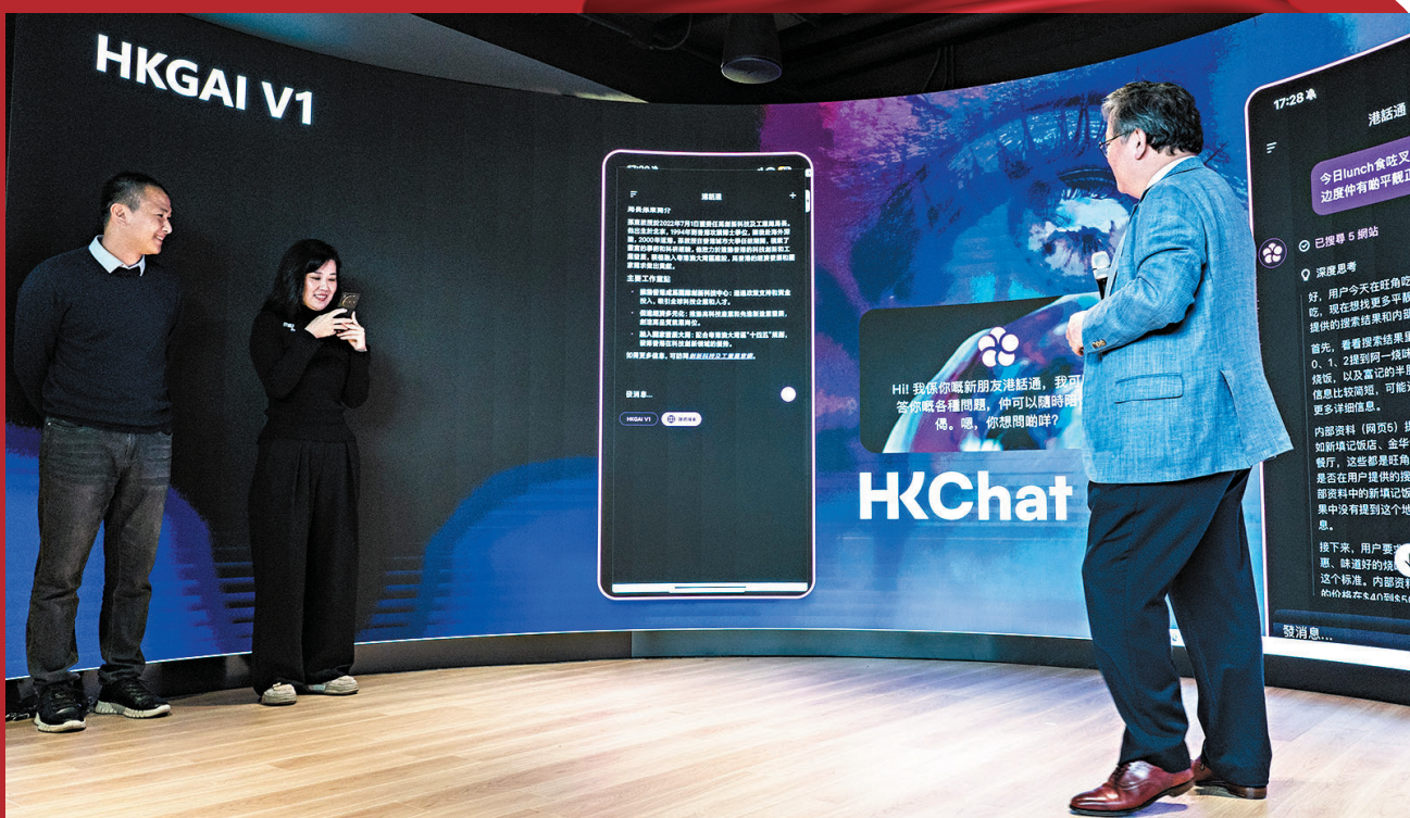
●HKGAI V1上月在港推出，這是全球首個基於DeepSeek全參數微調研發的模型。