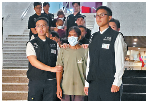
●入境處行動中拘捕8名黑工及1名懷疑僱主。

咁勁先得嘍……連一隻窗都無得剩，你話幾緊要！」當肇事單位大門被爆開後，赫見男屋主已受傷倒臥屋內，數名消防員隨即入屋將其抬出急救，「但佢（男屋主）都無晒知覺、無反應……」