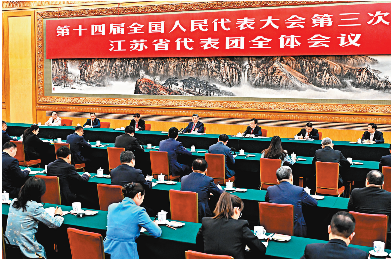
●3月5日下午，中共中央總書記、國家主席、中央軍委主席習近平參加他所在的十四屆全國人大三次會議江蘇代表團審議。

香港文匯報訊 據新華社報道，中共中央總書記、國家主席、中央軍委主席習近平5日下午在參加他所在的十四屆全國人大三次會議江蘇代表團審議時強調，圓滿實現「十四五」發展目標，經濟大省要挑大樑。江蘇要把握好挑大樑的着力點，在推動科技創新和產業創新融合上打頭陣，在推進深層次改革和高水平開放上勇爭先，在落實國家重大發展戰略上走在前，在促進全體人民共同富裕上作示範。