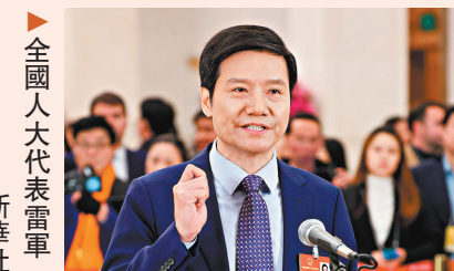
▲全國人大代表雷軍