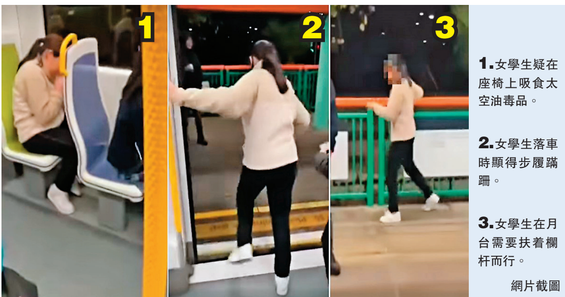
1.女學生疑在座椅上吸食太空油毒品。 2.女學生落車時顯得步履蹣跚。 3.女學生在月台需要扶着欄杆而行。

據了解，警方於前日(6日)晚上7時許接到多名市民舉報，指在天水圍輕鐵車廂內和天瑞站月台附近見到一名少女疑似吸毒。警方到場後搜尋，在天瑞商場找到該名少女，在其身上發現一支電子煙和一個懷疑太空油煙彈，以「藏有危險