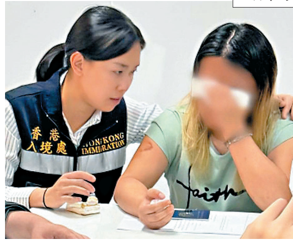
●專責小組人員與獲救港人會面期間，一名獲救女子激動落淚。