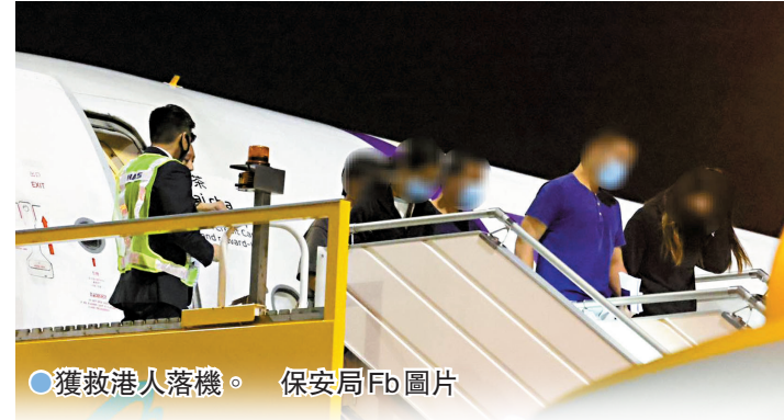
●獲救港人落機。保安局Fb圖片

陳克勤相信，在中國、泰國以及多個東南亞國家政府的介入下，不少電腦園區已難再運作，加上特區政府在香港機場及多個離境口岸已加強宣傳，以及媒體廣泛報道，市民的警覺性已經提高，將有助減少受害者。