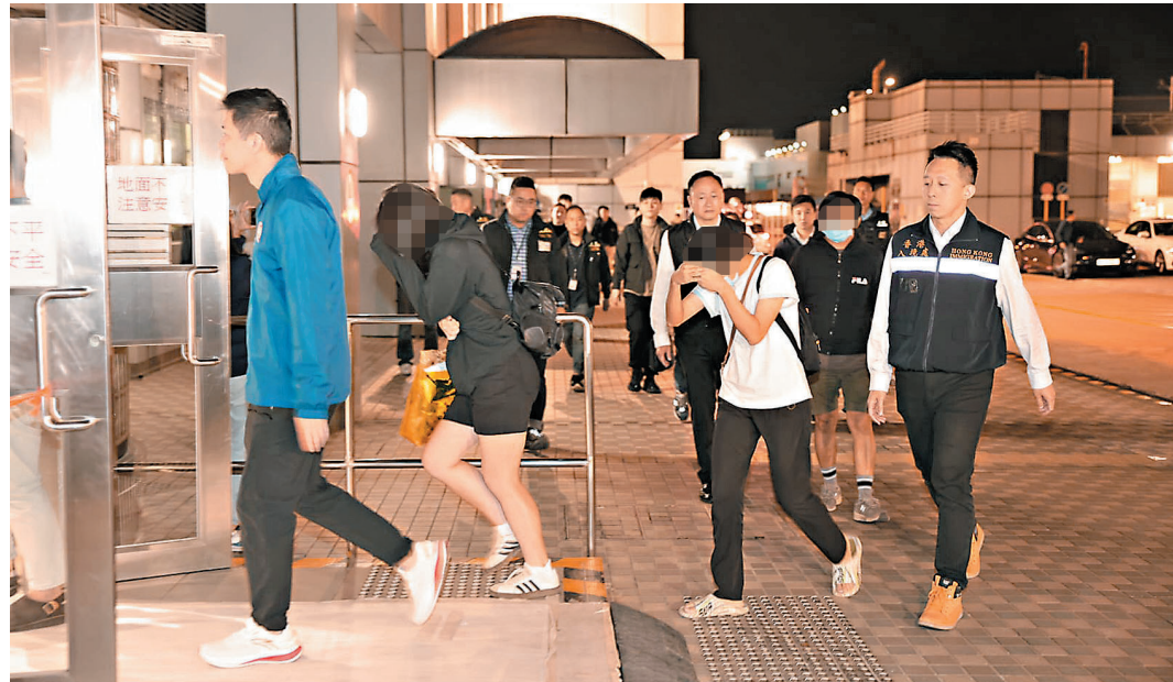
▲5名獲救港人由專責小組人員陪同到機場警署協助調查。