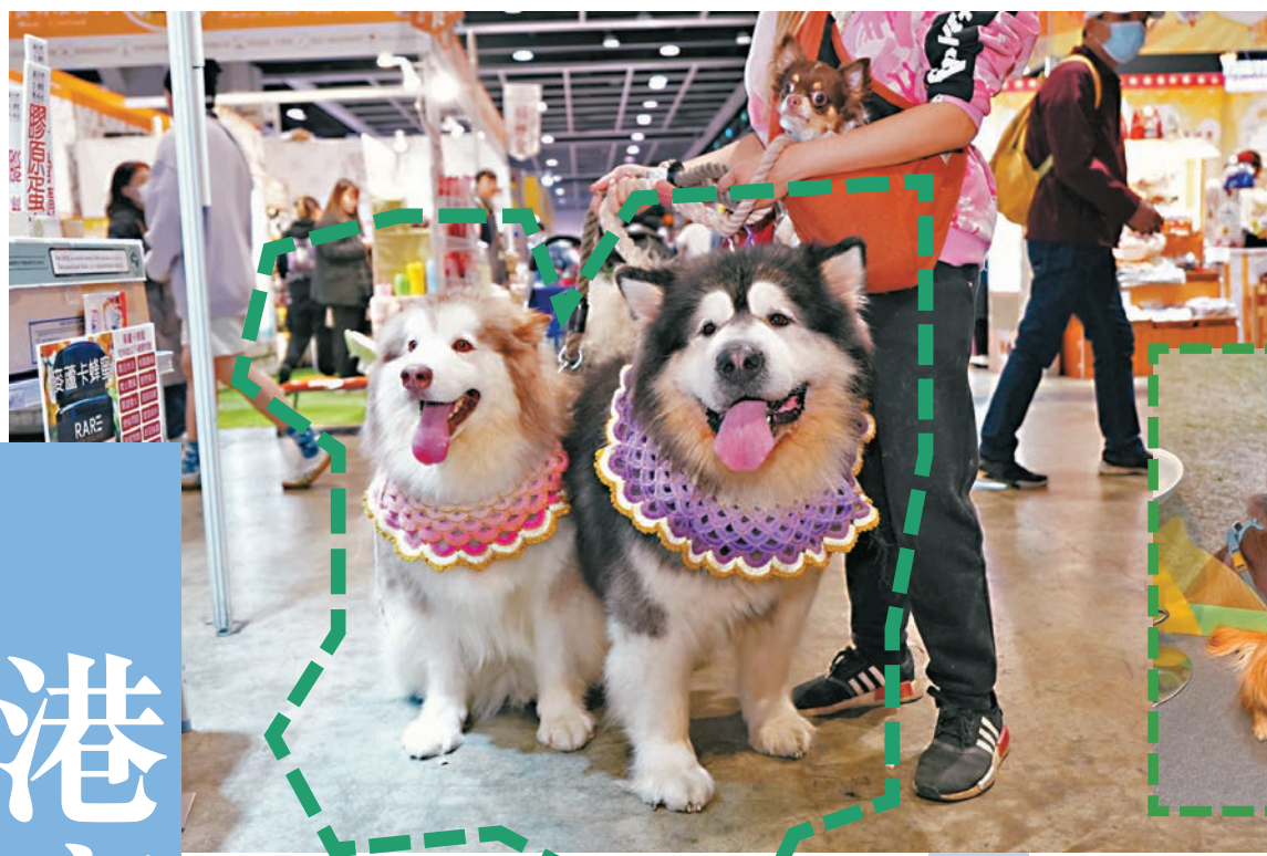
●今年2月舉辦的「香港寵物節2025」，短短4日生意額突破億元創新高，現場平均消費高達2,300元。圖為香港寵物節現場圖。