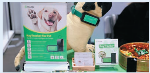
●GlocalMe在寵物節期間展出了一款全球寵物追蹤器。

來自中國台灣的寵物品牌「五歲半」也是第一次離島參展，產品以台灣毛孩體質和氣候為考量，選用人食用等級食材製成。現場負責人表示，香港寵物主的消費能力強，對新興品牌接受度較高，且兩地氣候相似，寵物的種類、特點也更加接近，十分適合作為品牌銷往海外的考察點，往後再拓展新加坡等其他市場。