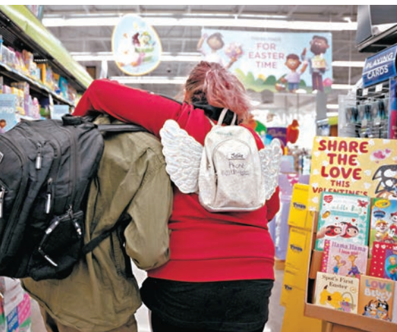
●美國本週公布CPI數據是市場焦點，投資者冀以此推斷出美聯儲未來利率政策方向。圖為美國路易斯維爾一間超市。資料圖片

另一方面，本周全球不同地區有多項重要經濟數據與消息公布，或會左右投資市場表現，包括內地公布2月新增人民幣貸款數據；內地公布2月廣義貨幣供應