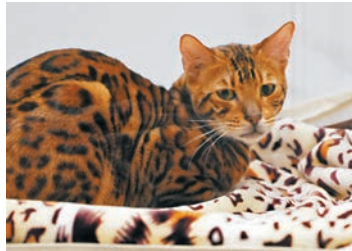
●香港不少寵物主愛養稀有的孟加拉貓。圖為孟加拉貓。