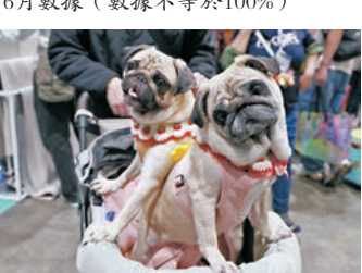
●香港寵物手術費用昂貴。圖為八哥。