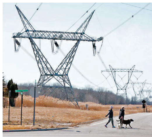
●安省向密歇根州等供電，圖為該州的輸電塔。

福特稱：「如果美國繼續升級(關稅)，我會毫不猶豫地徹底切斷電力，相信我，我不想這樣做。我為美國人民感到難過，因這場貿易戰不是由美國人民發起的，