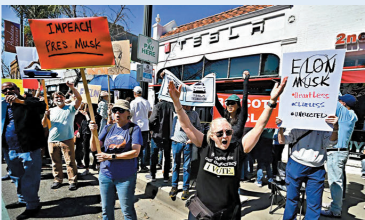
●DOGE連串裁員行動引發美國多地爆發抵制Tesla抗議。

DOGE連串裁員行動引發美國多地爆發抵制Tesla抗議，馬斯克接受霍士新聞訪問時，被問及成為DOGE主管以來，其個人生意情況如何，馬斯克表示個人