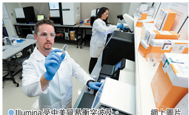
●Illumina受中美貿易衝突波及。網上圖片

Illumina一年43億美元(約334億港元)營收中，中國市場約佔7%。丁格拉表示，公司目前專注於中國以外的業務，並取得重大進展，以實現到2027年公司收入增長達到較高個位數百分比的目標。Illumina在中國還有一座組裝較低階測序儀的工廠，同時將繼續向中國客戶出口化學試劑及其他服務。