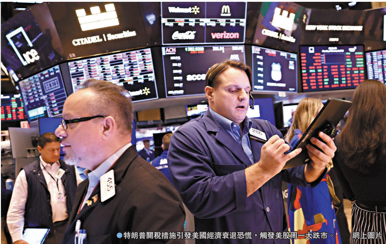
●特朗普關稅措施引發美國經濟衰退恐慌，觸發美股周一大冧市。網上圖片

許多投資者先前憧憬「美國例外論」，即美國被認為相對於其他國家擁有的優勢，例如經濟實力和技術創新，將助推美股今年再現強勁升幅。然而對貿易戰的擔憂、經濟增長放緩的跡象，以及人工智能(AI)交易熄火，已讓這種樂觀情緒減退。標普500指數上周累計下跌3.1%，回吐特朗普當選總統後的漲幅，納指亦較近期高位下跌10%以上，進入調整區間。