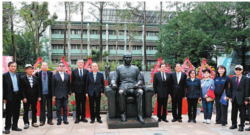
●孫中山先生逝世100周年，前台灣地區領導人馬英九（右六）12日上午到中山文化園區中山碑林，出席紀念活動。