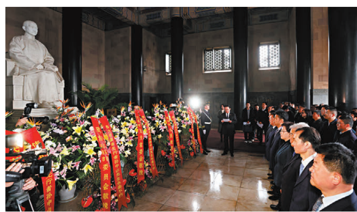
●3月12日，江蘇省暨南京市各界人士在中山陵舉行謁陵儀式，紀念孫中山先生逝世100周年。

台灣時事評論員謝志傳受訪表示，孫中山先生終身為中華民族奮鬥，而今兩岸中國人當相向而行、勳力同心，為民族復興打開康莊大道，早日促成祖國完全統一，以實現中山先生的宏願。