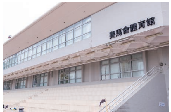
●馬會撥款支持體育學院重建，包括將運動員宿舍改建成現今的「賽馬會體育館」。

2022年，馬會成立香港賽馬會馬術隊(內地)，以培育及支援駐內地有潛質的香港年輕騎手。