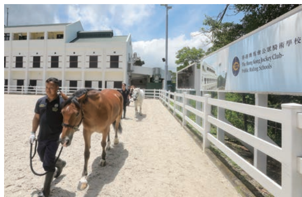
●馬會轄下公眾騎術學校推動馬術運動普及化。圖為鯉魚門公眾騎校。