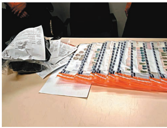
●遺留快餐店內的背囊最後送到警署，背囊內10萬元現金等財物全部失而復得。