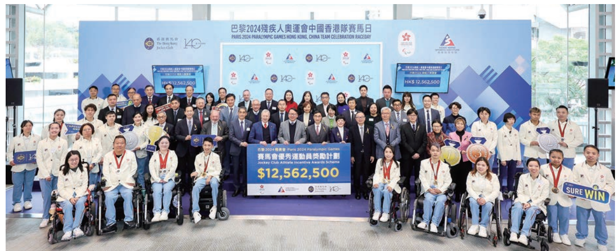
●政務司司長陳國基(第二排右十二)、馬會主席利子厚(第二排右十一)、馬會行政總裁應家柏(第二排右十三)連同嘉賓、馬會董事以及中國香港隊代表，在「賽馬會優秀運動員獎勵計劃」支票頒授儀式上合照。最前排左五為何宛淇。