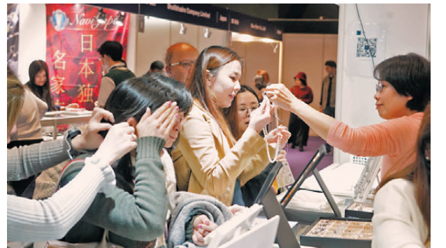
●雖然珍珠於過去一年漲幅超過50%，但仍吸引不少買家購買。