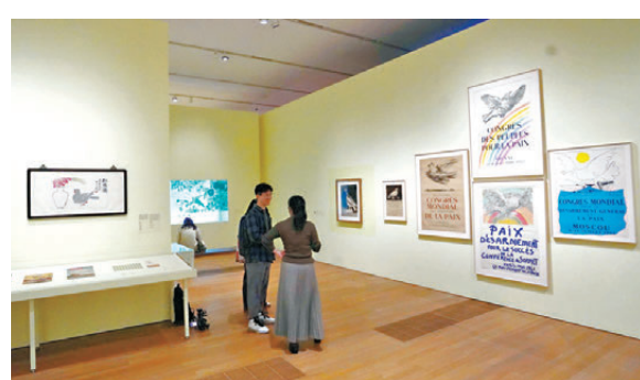
●畢加索的鴿子相關作品，與其他人創作的鴿子相關作品作對比。