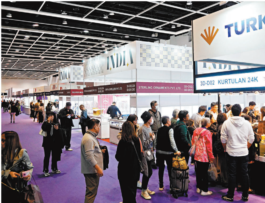
●香港舉辦的國際珠寶展，國際鑽石、寶石及珍珠展，深受業界人士認可，吸引逾140個國家及地區、數以萬名買家到場採購。