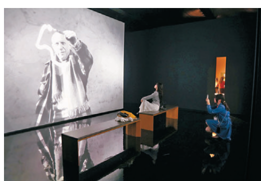
●紀錄片播放及互動裝置。