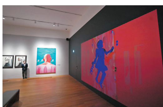
●女藝術家製造的數碼動畫作品(右)，以回應畢加索繪畫的女性畫像。