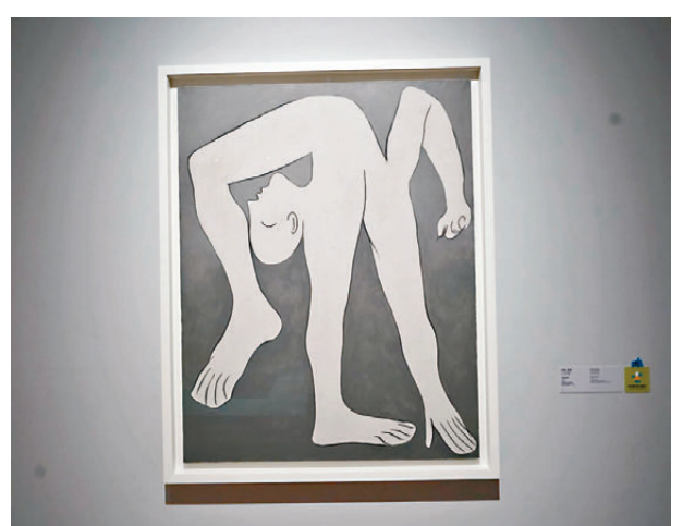
●圖為畢加索1930年代表作《雜技演員》的油彩布本。