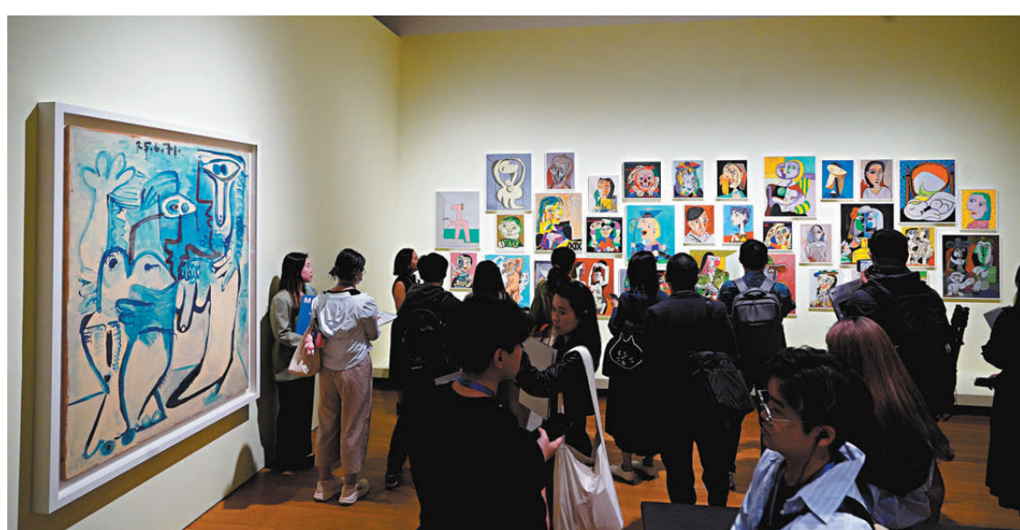
●M+特別展覽「香港賽馬會呈獻系列：畢加索——與亞洲對話」於明天開幕。昨日舉行傳媒預展。

除靜態展示外，展覽設置了一個播放紀錄片及互動裝置的區域，觀眾可透過畫板與畫筆，跟隨紀錄片中的畢加索一起畫畫，畫畫的過程亦會被製成電子作品，觀眾可以透過掃描二維碼保留做紀念，又布置了多個窗口，讓觀眾可以透過這些窗口看到其他展區的作品，反映了跨越時間與空間、看到不同作品在交流對話的展覽主題。