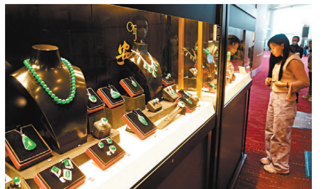
●翡翠近年款式愈趨年輕化，打破固有的「傳統、老氣」形象。

貿發局早前就兩個展覽進行的現場問卷調查結果顯示，44.2%受訪買家及展商預計未來一兩年整體銷售額將會上升，50.6%受訪者預計持平。整體而言，受訪者認為未來兩年珠寶產品於中東、印度、澳洲及太平洋群島銷售市場的增長前景最理想。產品方面，受訪者認為今年時尚首飾(61.9%)、貴重珠寶(39.1%)、輕奢首飾(24.4%)有最大增長潛力。