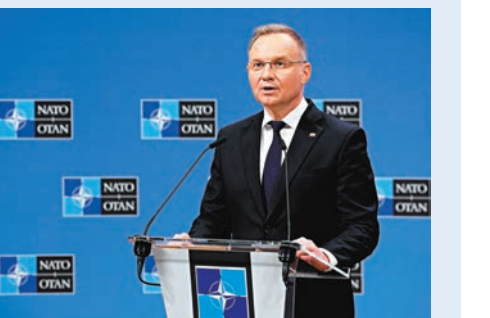
●杜達已提議美國將核彈頭部署至波蘭領土，以威懾俄羅斯。