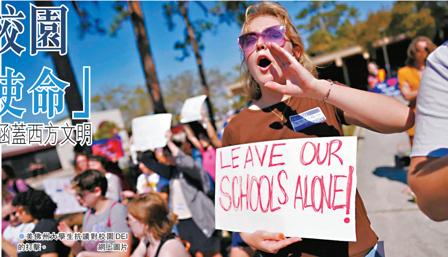
●美佛州大學生抗議對校園DEI的打壓。網上圖片

香港文匯報訊 美國總統特朗普重返白宮後，大舉打壓美國大學校園，要求終止「多元、公平和包容性」(DEI) 議題，威脅對拒絕跟從的學校「門水喉」、不再提供聯邦資金。《華爾街日報》周四(3月12日) 報道，在特朗普就任前，佛羅里達州已連續3年在共和黨籍州長德桑蒂斯安排下接連立法，推動校園向保守派靠攏，佛州的現狀或許就是美國大學校園在特朗普治下的未來寫照。