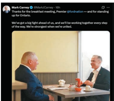
●卡尼(右)與福特共晉早餐，並帖文表示國家團結時才是最強大。

安大略省省長福特認為卡尼具有精明的商業頭腦，應當懂得與同是商界出身的特朗普周旋，而且卡尼憑着過往以務實方式解決金融危機，福特希望加、美之間的貿易戰不會進一步惡化。