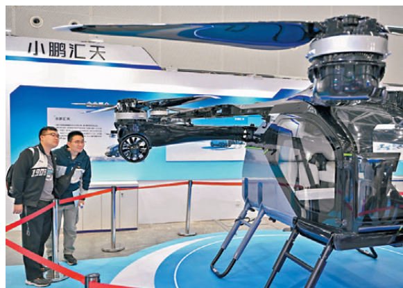
● 招聘會上展示的小鵬匯天分體式飛行汽車「陸地航母」吸引求職者。