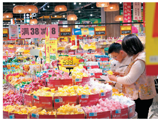
● 早前，消費者在山東濰坊高密市一家超市購物。

此外，高質量的商品和服務供給是創造有效需求、促進潛在需求轉化為現實消費的重要條件。為適應服務消費快速發展和商品消費需求提質升級的趨勢，行動方案明確，擴大電信、醫療、教育等領域開放試點，及時清理對消費的不合理限制，完善市場准入負面清單管理模式，充分體現出鼓勵供給創新、推動供給與消費有效匹配的政策思路。