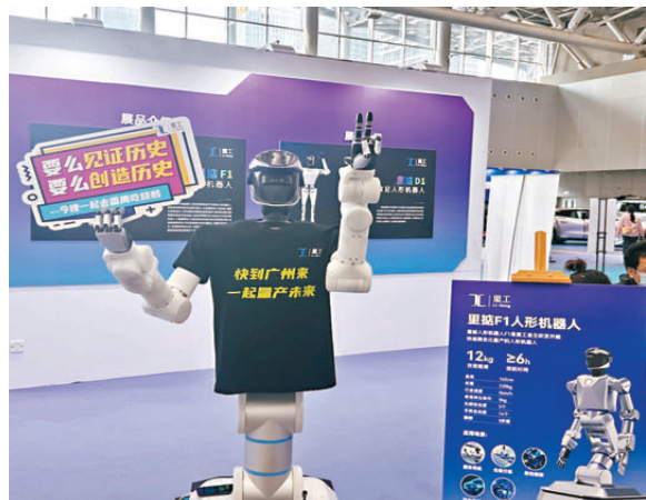
● 廣州里工實業等企業開出年薪百萬攬才。圖為里工實業的AI機器人。