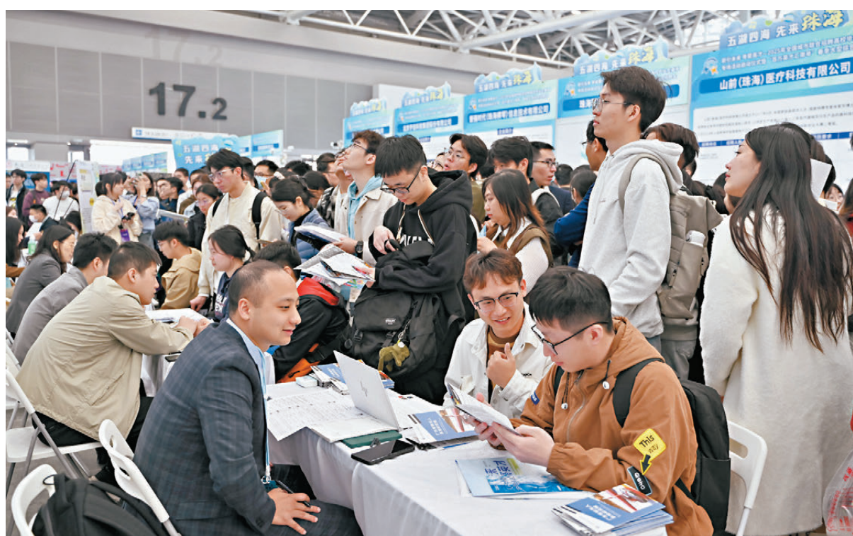
● 16日，「百萬英才匯南粵」招聘會在廣州啟幕，來自先進製造業、低空經濟、人工智能、新能源等行業的約千家單位、企業參會，向求職者提供逾五萬個崗位。圖為求職者與招聘人員（左）交流。中新社

本場大型招聘會由人力資源社會保障部、教育部與廣東省委、省政府聯合主辦。廣東省省長王偉中在招聘會啟動儀式上致辭稱，今天的廣東比以往任何時候都更加重視人才、渴求人才、珍愛人才。廣東將以本次大型招聘會為起點，分期推出百萬優質崗位，推動各類招聘活動貫穿全年，火熱開展。廣東在今年事業單位集中公開招聘基礎上，還將增加超過一萬個崗位招募高層次和急需緊缺人才。