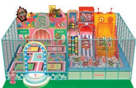
「懷」童遊樂園效果圖

今年春日，iSQUARE 國際廣場聯乘以爆炸糖風靡全球的零食品牌 Striking，由4月4日至5月5日呈獻「爆」趣童玩之旅，以爆炸糖的繽紛色彩為主調，邀得 Striking 爆炸糖極具代表性的 Strikids (爆炸仔) 小隊為設計重要元素，首次走入商場的 Striking 以不同色彩閃亮登場，俏皮靈動的他們，令整個氣氛變得熱鬧又活潑！