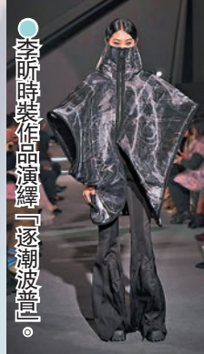
李昕時裝作品演繹「逐漸波普」。