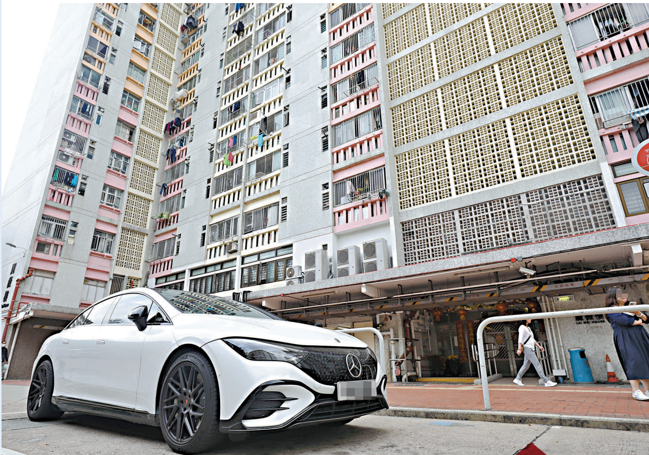
●明年10月1日起，公屋富戶需要繳交的額外租金，由現時的1.5倍至2倍租金，調高至2.5倍至4.5倍。