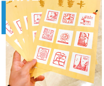
●展覽專門設置蓋章打卡區。