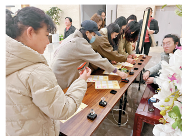
●在展覽現場, 觀眾手持筆記本或文創卡片, 依次體驗特色印章。

香港文匯報訊 (記者 劉蕊、實習記者 任舜丞 河南報道) 近年「蓋章熱」席捲文壇, 從故宮文創到地方博物館, 一枚枚特色印章成為遊客爭相收藏的「文化打卡憑證」。在鄭州商代都城遺址博物院, 一場跨越時空的「文明互鑒——世界圖紋與印記展」正以方寸印鑒為媒介, 將蓋章文化推向新維度。展覽精選百餘方中外古印, 並設置趣味蓋章打卡, 吸引觀眾在「蓋印」中觸摸文明脈絡。