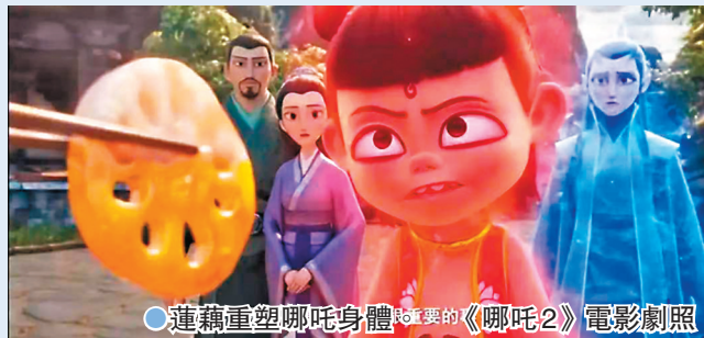
●蓮藕重塑哪吒身體的《哪吒2》電影劇照