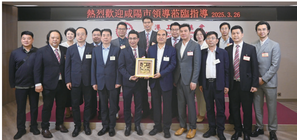
▲香港工商總會接待咸陽市交流團，雙方互贈紀念品。