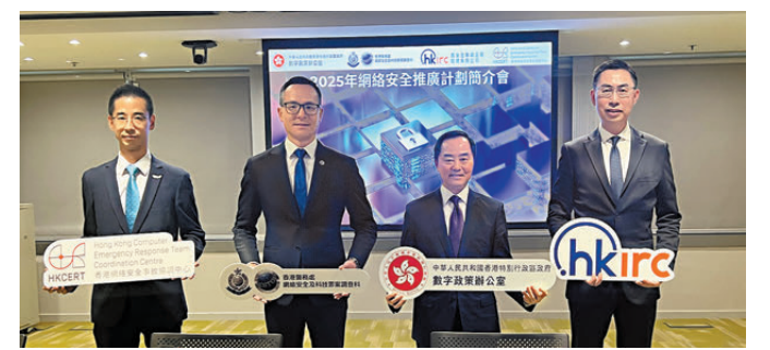
●數字辦介紹今年推廣網絡安全的重點工作。

展超根據庭上展示的高德停車場街景相片，指根據圖中尚德停車場環境，一個20公斤土製炸彈若在上址爆炸，可造成全方位無差別攻擊，任何人都會受傷，停車場地面位置的人會受到很大影響，而2樓以上因有建築物遮擋，故威力會減低，惟該處有玻璃外牆，爆炸時組件會被衝擊波「衝散」及「散落嚟」。