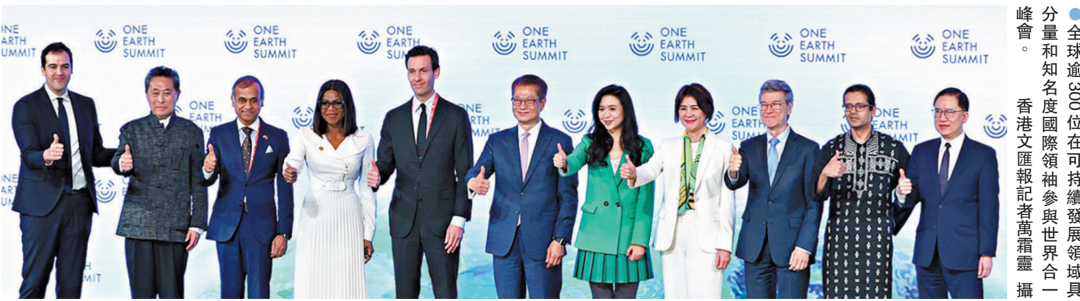
●全球逾300位在可持續發展領域具分量和知名度國際領袖參與世界合一峰會。

同一場合的聯合國可持續發展解決方案網絡主席Jeffrey Sachs(傑佛瑞·大衛·薩克斯)則提及「一帶一路」倡議在全球能源轉型中具有重要性，「一帶一路」不僅促進沿線國家及地區之間的合作，也為綠色能源項目提供資金和技術支持，有助於構建一個更加環保的全球經濟體系。