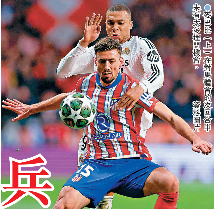
●麥巴比(上)在對馬體會的次回合中未有太多埋門機會。資料圖片

月作客對阿仙奴的歐聯8強首回合比賽。他們均是皇馬的核心球員，假如如同時間停賽無疑可令「兵工廠」有機會坐享漁人之利。