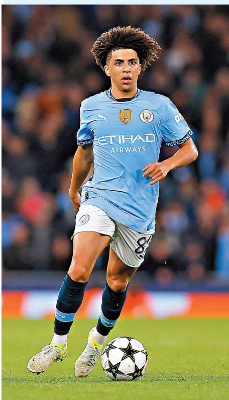
●曼城右閘歷高利維斯有望在盞賽輪換擔正。資料圖片

香港文匯報訊（記者張發兒）英格蘭足總盃本周重燃戰火，8強比賽只餘下曼城一支「Big 6」球隊，「藍月亮」要避免今季四大皆空，星期日作客對般尼茅夫一仗絕對是非勝不可。（Now651台周日晚11:30p.m.直播）