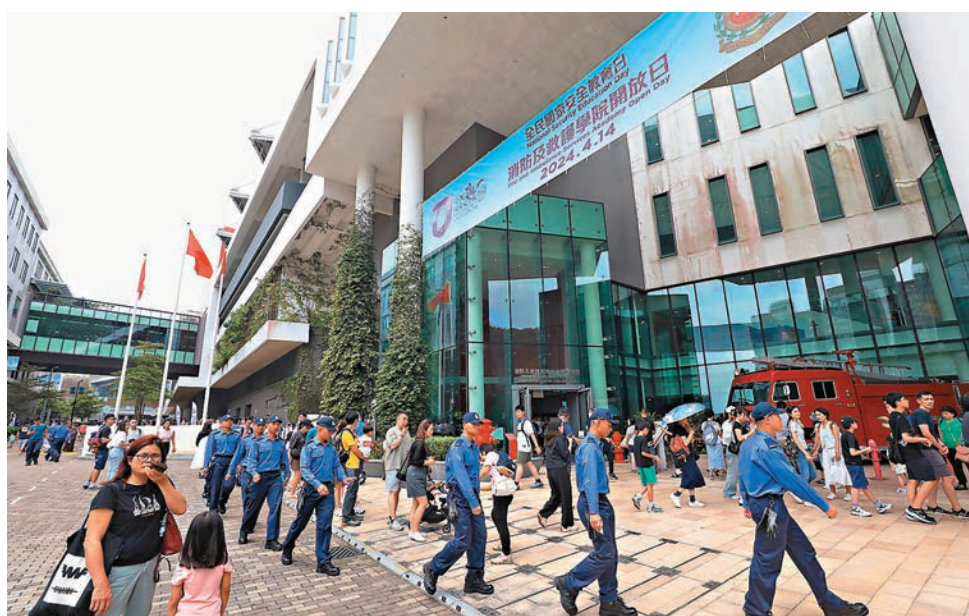
●圖為消防及救護學院去年的「全民國家安全教育日」開放日情況。

海關表示，開放日當天，香港海關學院會設置不同的活動，包括國家安全教育展覽、表演和攤位遊戲，以互動方式介紹國家安全的訊息及重要性。海關龍獅團和海關搜查犬會於當日參與演出，另外亦有槍械及裝備展覽。