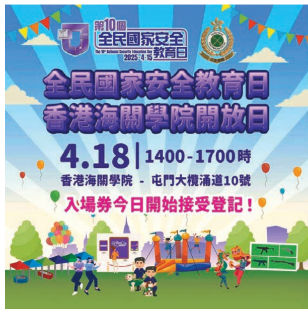
●海關學院開放日入場券接受登記。