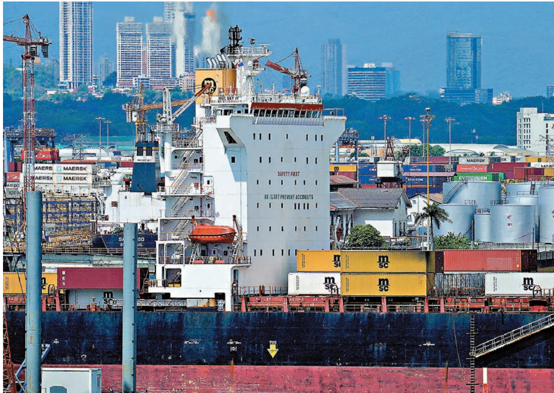
●長和記擬出售巴拿馬運河兩端港口資產事持續引發熱議。 資料圖片

香港文匯報訊 長和記擬出售巴拿馬運河兩端港口資產持續引發熱議。外交部發言人郭嘉昆昨日主持例行記者會時，有記者提問，據報道，中國國家市場監督管理總局表示，將審查長和記擬向貝萊德財團出售有關港口資產事。郭嘉昆表示，我們注意到有關報道，國家市場監督管理總局就此表示，注意到此交易，將依法進行審查，保護市場公平競爭，維護社會公共利益。他強調，中方一貫堅決反對利用經濟脅迫、霸道霸凌侵犯損害他國正當權益的行為。同時，國務院港澳辦、中央政府駐港聯絡辦網站昨日繼續轉載《大公報》的評論文章，指出香港政商界支持依法審查，呼籲長和要三思。