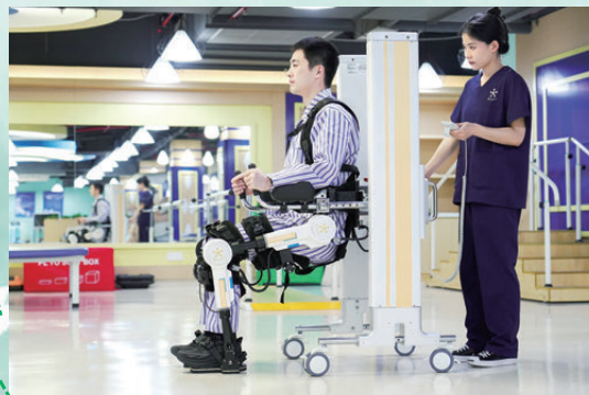
●農行為程天科技提供「一項目一方案」金融服務。

杭州程天科技有限公司是省級專精特新企業和國家級高新技術企業，致力於核心算法與核心元器件在內的外骨骼機器人技術的研發與應用。在企業發展被資金短缺困擾時，農行浙江