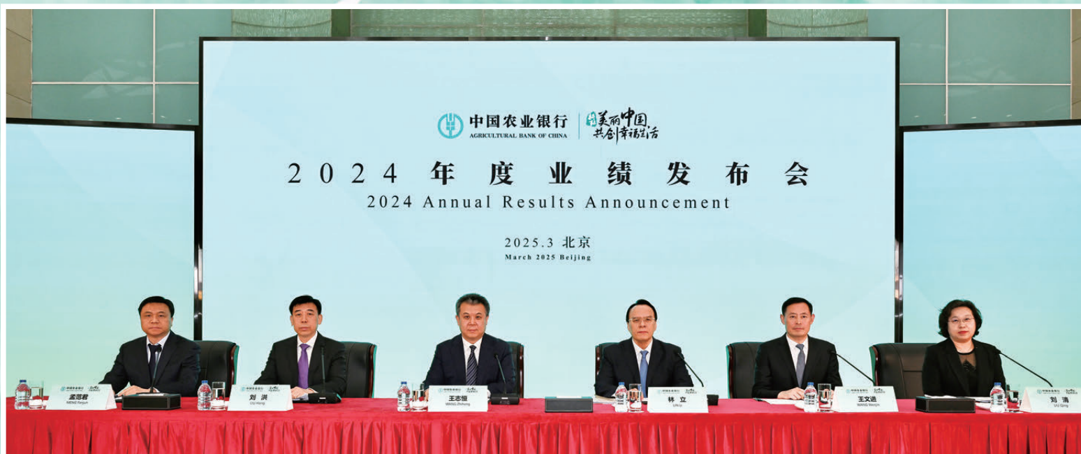
●農行2024年業績發布會現場，從左至右：副行長孟範君、副行長劉洪、行長王志恆、副行長林立、副行長王文進、董事會秘書劉清。

對於普惠金融的風控，農行並沒有為了追求規模而放鬆。王志恆表示，農行高度重視普惠零售領域風險管理，採取了一系列措施，包括進一步嚴格准入管理，不斷完善產品模型，豐富多維度的數據來源，持續優化業務流程，在業務流程的優化過程中，更加強調線上和線下的有機融合，以及對風險的集中監控。